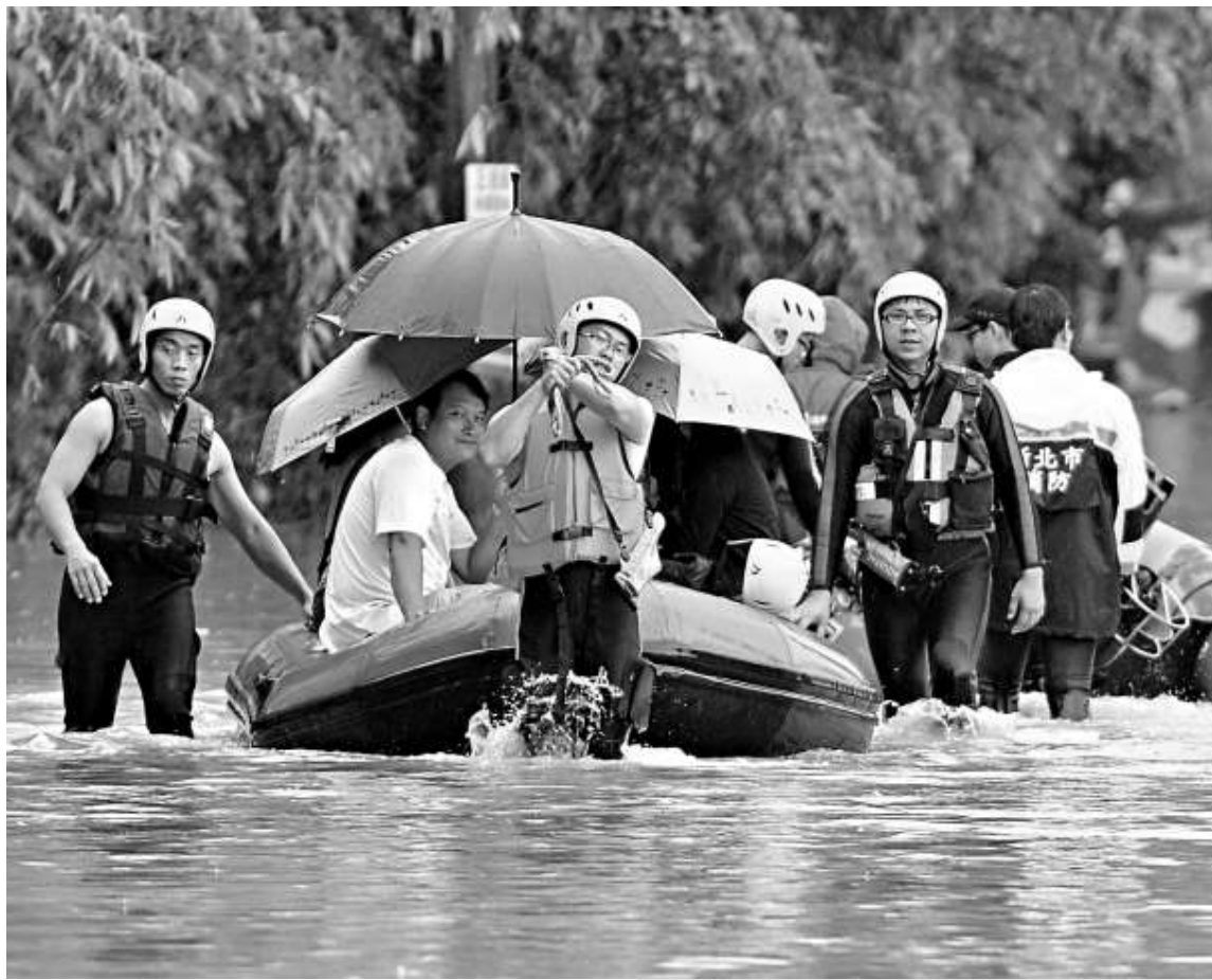
▲新北市12日受豪雨影響，嚴重淹水。消防隊員以橡皮艇救援受困民眾

豪雨對交通造成很大影響。當局農業主管部門12日傍晚更新土石流信息顯示，土石流紅色警戒共411條，分布在9縣36鄉150村，黃色警戒416條，