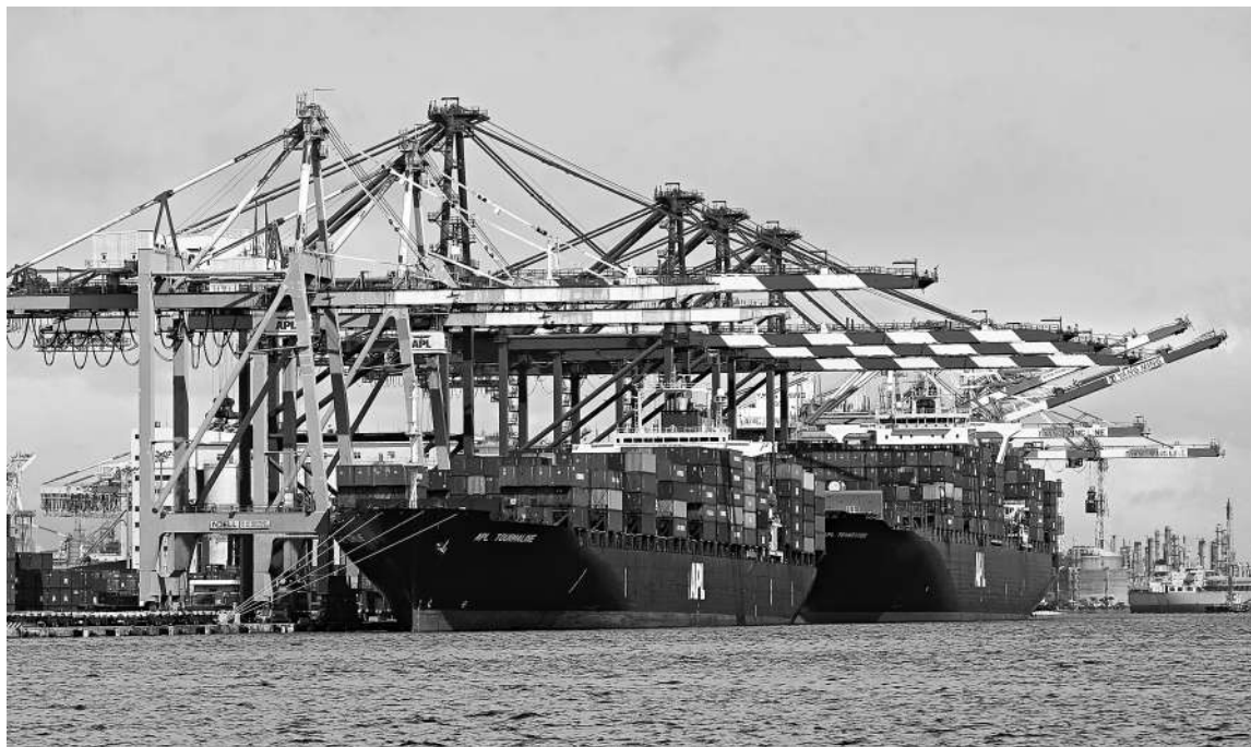
▲這幾年隨着兩岸經貿合作日益緊密，高雄港貨櫃吞吐量有增長的趨勢