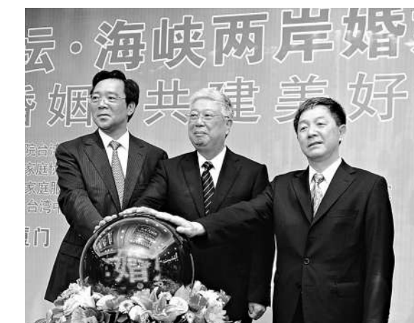
▲民政部部長李立國（中）、國台辦副主任葉克冬（右）、福建省副省長陳榮凱（左）17日為海峽兩岸婚姻家庭服務網啓動開通儀式

湖南鄧先生17年前透過友人介紹與從台灣回湖南探親的妻子喜結姻緣。他指出，兩岸醫療、教育、社保等方面的障礙是「兩岸夫妻」面臨的最大問題。他解釋，由於兩岸社會上各種社會保障制度都不能接軌，使不少「兩岸夫妻」為下一代的教育、自己的醫療保障等疲於奔命，「我的太太在大陸這邊生了病需要回到台灣治病，因為她沒有這邊的醫保！」