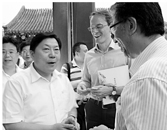
▲北京市委常委、宣傳部長、副市長魯煒（左）與外國駐京記者熱情交流

驗，北京的新聞服務工作更顯人性化特色。去年日本大地震發生後，很多國際記者要奔赴日本採訪報道。北京立即舉辦了「境外記者防災避險及自救互救技能培訓」的講座，現場講解人類遭遇險情時的反應和避險、自救互救等知識，與境外記者分享逃生技巧並演示自救方法。