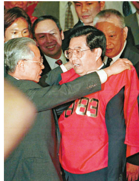
▲胡主席參觀香港聯交所，獲贈出市代表紅馬甲

當日上午十一時四十分，胡錦濤為深圳灣口岸開通儀式剪綵，圓滿結束訪港行程，也標示着香港與深圳兩地之間的第四個陸路口岸正式投入使用。口岸的開通，進一步促進深港兩地人員和貨物往來，促進兩地經濟發展。