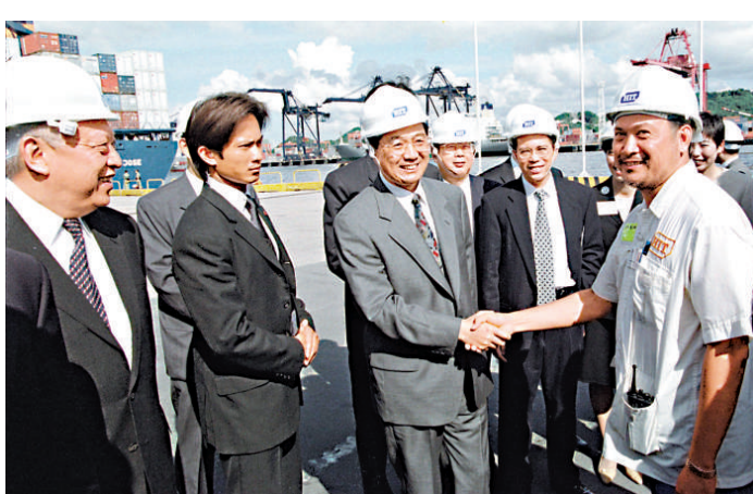
▲胡錦濤九九九年首次訪港，參觀葵涌七號貨櫃碼頭，與工人握手，一展親民作風