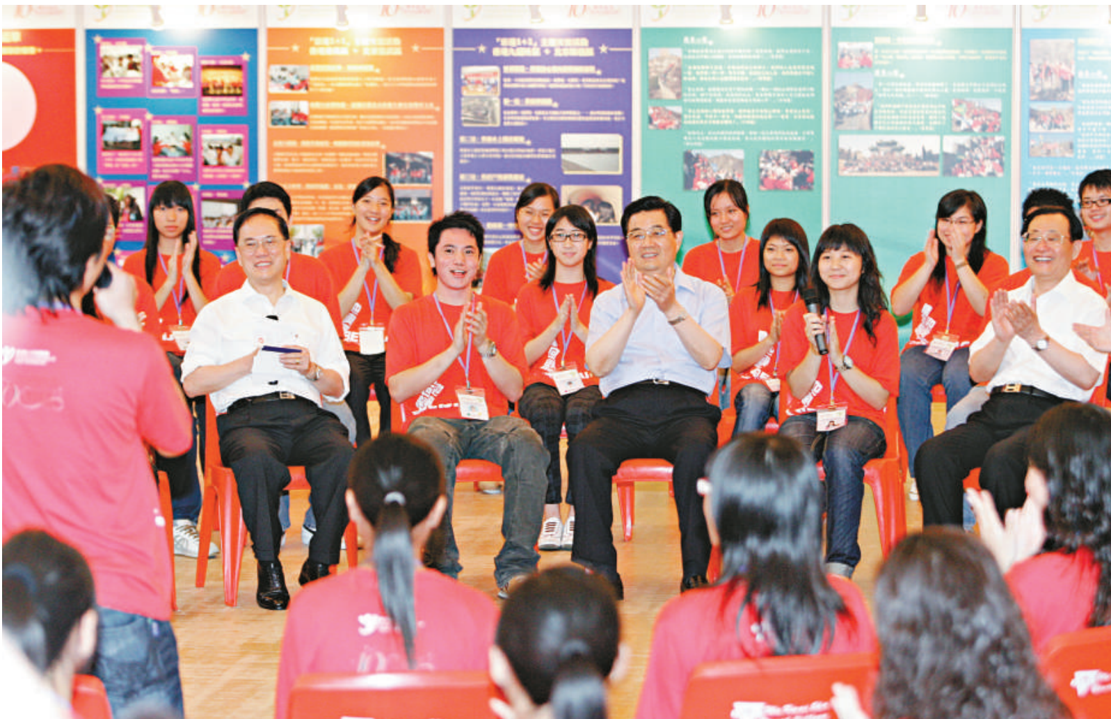
▲胡主席〇七年訪港與青少年交流，聆聽他們發言

二〇一〇年九月六日，胡錦濤主席在深圳與香港地區行政長官曾蔭權見面時，再度向在馬尼拉劫持人質事件中的死傷者家屬及傷者轉達慰問，希望他們可以平服心情，並表示中央政府會繼續支持特區政府做好善後工作。殷殷關懷，溢於言表。