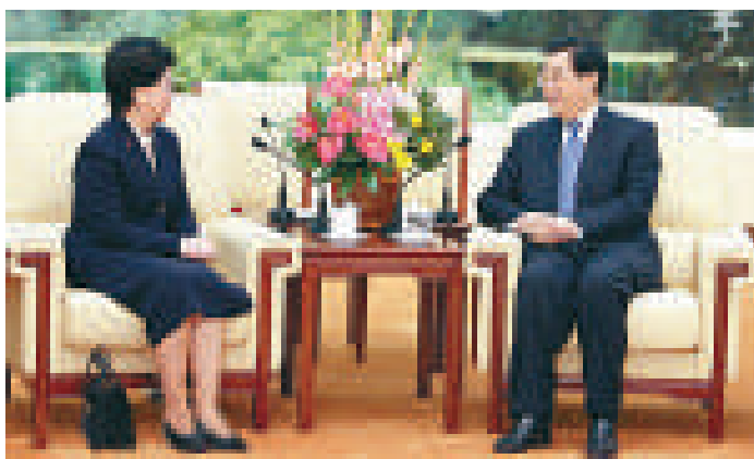
▲胡錦濤在北京人民大會堂接見世界衛生組織總幹事陳馮富珍