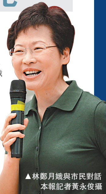
▲林鄭月娥與市民對話

隨即獲在場人士報以掌聲。 林鄭月娥希望，大家給予涉事官員機會、空間和時間，作全面認真及誠懇交代，在事件未交代前，不應判定當事人涉誠信問題。論壇上，林鄭月娥表示，新政府會全面覆核家庭議會政策，審視現時公屋富戶問題。而目前，她正與勞工及福利局局長張建宗研究增加生果金金額問題。 至於基層醫療問題，食局局長高永文表示，公私營醫療的平衡發展十分重要，承諾上任後會關注基層，特別是長者的醫療服務問題，確保醫管局資源用得其所。