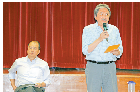
▲曾俊華(右)夥拍張建宗(左)到大埔聽取市民意見

【本報訊】記者汪澄澄報道：財政司司長曾俊華和勞工及福利局局長張建宗，昨日下午到大埔聽取市民意見。曾俊華暗示政府不會再派六千元，強調政府措施的首要考慮是針對性。 曾俊華與張建宗昨日下午一同前往大埔舊墟公立學校聆聽居民意見，張建宗一開場便強調官員落區絕非「做騷」，希望市民講出心聲，他與同事會將意見充分反映給政府有關部門。昨日共有一百多街坊出席，氣氛熱烈。 有基層居民希望政府再派錢，曾俊華回應說，前年決定派發六千元，是希望分享財富，但現時歐美經濟較差且不穩定，全球經濟可能再惡化，並危及本港，如今年第一季的本地出口增長便僅百分之零點四。他形容現階段為困難時期，需要小心。他續指，政府措施的首要考慮為針對性，希望利用有限的資源幫助到有需要的市民。 一同出席的張建宗則被問到安老院舍不足如何解決，他表示政府現時鼓勵長者居家安老，這亦符合大部分長者意願，而政府會推出配套措施，如明年四月會推出服務券，長者可憑券購買物理治療，以至是護理上門服務等。此外，政府會繼續向私營安老院買位，希望再增加一千七百個。另有市民認為申請交通津貼的審批方式需改善，張建宗表示，九月的中期檢討是關鍵，他會認真對待，充分搜集數據，回應市民訴求。