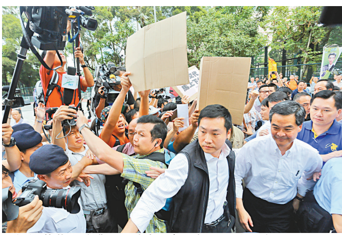
▲梁振英落區時遭到示威者狙擊，場面一度混亂

政務司司長林鄭月娥夥拍食物及衛生局局長高永文到訪鴨洲時，也遇到一批示威者。其他官員則比較「幸運」，未有遇到激烈示威者推撞場面。財政司司長曾華彰夥拍勞工及福利局局長張建宗到訪大埔；發展局局長麥齊光夥拍保安局局長黎棟國訪東涌；財經事務及庫務局局長陳家強夥拍公務員事務局長鄧國威訪九龍城；民政事務局長曾德成則夥拍商務及經濟發展局局長蘇錦樑到訪西環。