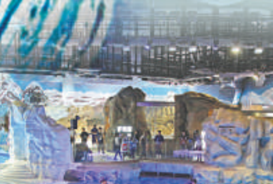
◀「冰極天地」展出逾百隻海豹、海象、企鵝