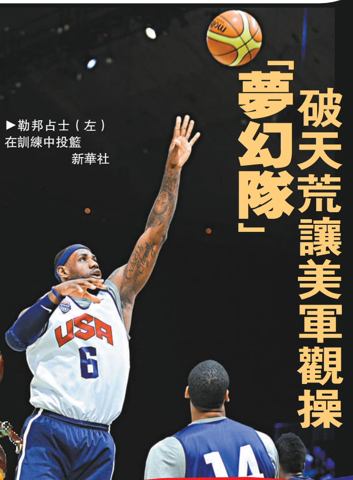
▲勒邦占士(左)在訓練中投籃。

據綜合外電俄羅斯十五日消息：俄羅斯撐杆跳女皇伊辛巴耶娃，將在今屆倫敦奧運會爭取金牌三連冠。伊辛巴耶娃近年表現有所下滑，但她依然充滿信心，可以在倫敦再次封后，更強調衝金的對手只有自己。伊辛巴耶娃亦透露自己的退役時間，表示將會在2013年莫斯科世錦賽後正式退役。