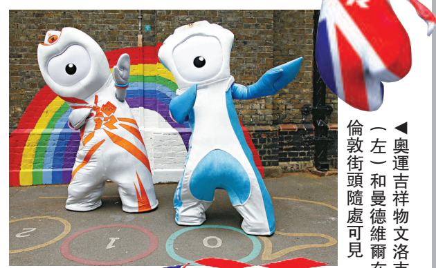
▲奧運吉祥物文洛克(左)和曼德維爾在倫敦街頭隨處可見