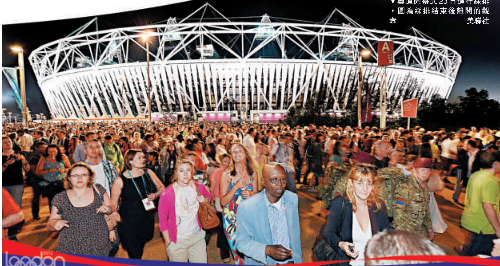
▼奧運開幕式23日進行綵排，圖為綵排結束後離開的觀眾

每屆奧運會，男子100米決賽都是萬眾矚目的一場巔峰對決。博彩公司除了一如既往的看好飛人博爾特，為他開出了1賠1.67的賠率，更單獨設立一項賭博，將比賽因為交通阻塞而推遲的賠率定為1賠101。