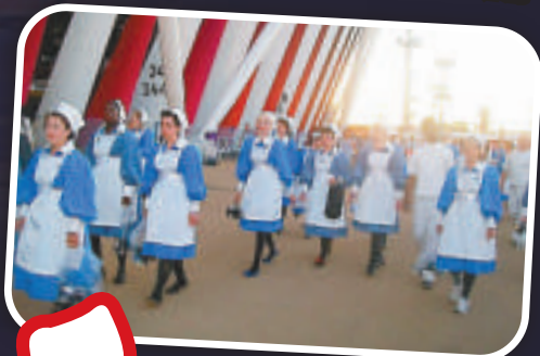
▲穿着英國傳統服飾的表演者綵排前在奧運場館外出現