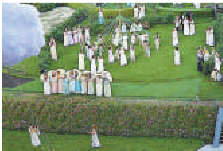
年輕的少女穿着英國傳統服裝表演 互聯網

「黑暗的撒旦磨坊」出自英國詩人威廉·布萊克的作品《耶路撒冷》，後來人們用來比喻英國的工業革命。因此在第二幕中，整個場館會從英國淳樸的鄉村轉換到工業革命時期的景象。表演者們將化身為紡織工人，礦工，鋼鐵廠工人還有工程師，帶領觀眾們回到工業革命時期被譽為「世界工廠」的英國。緊接着人們將繼續跟着歷史的腳步向前，來到戰後的英國。一支人數達12000人的表演隊伍將會在觀眾面前浩蕩走過。其中有裝扮成護士的表演者和推着病床的助理員工，他們象徵着英國國家醫療服務體系和福利國家的身份；還有象徵着創新精神的表演家，音樂家，演員；為向甲殼蟲樂隊致敬而穿上 Sgt Pepper 服裝（《Sgt Pepper》為專輯名稱）的舞者。表演還會展示英國多元文化的一面，以及近來的政治波動。整場表演務求向觀眾呈現英國戰後的變化和發展。