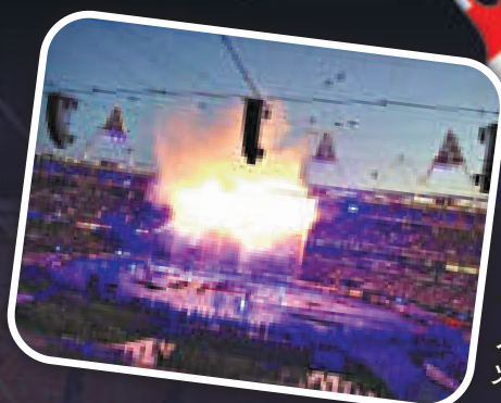
舞台上令人炫目的煙火表演 互聯網