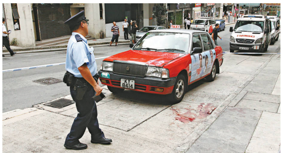
▼被泰籍漢跳樓壓損的士留下一攤血漬

【本報訊】一名有斷袖癖中年泰籍漢，疑因患上愛滋病大受打擊，昨日在上環水坑口街寓所與同居洋漢激烈爭吵後，由四樓攀窗躍下自殺，壓毀樓下一輛的士重創昏迷，送醫院搶救不治；因涉及世紀絕症，醫護人員及件工均需穿上全套防護衣，氣氛相當緊張。另外洗街車到場清洗血跡時，有警員叮囑工友小心及「洗乾淨啲」；倒霉的士司機目睹車輛被損毀一臉無奈。