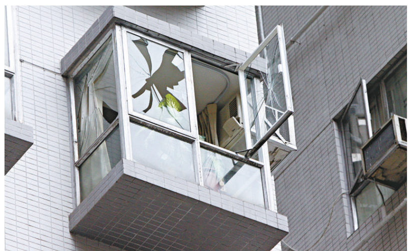
▲泰籍漢因患上愛滋病及感情有變而攀窗跳樓