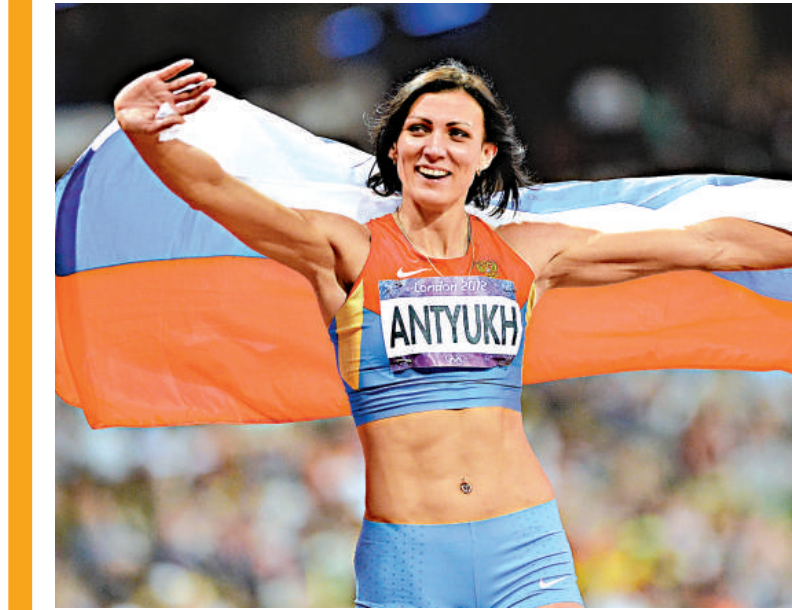
▲俄羅斯警官選手安特尤克8日獲得女子400米欄冠軍