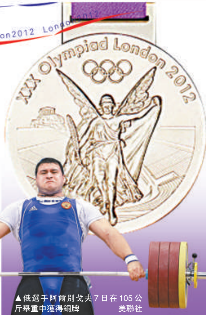
▲俄選手阿爾別戈夫7日在105公斤舉重中獲得銅牌

俄聯邦級體育運動的主要管理機構是俄羅斯奧林匹克委員會，2010年前該機構一直作為非政府組織運行，但為了「恢復俄羅斯在國際體育舞台上的地位」，俄奧委會於2010年修改憲章，由時任副總理的茹科夫出任主席，平添官方色彩。