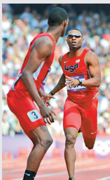
▲美國運動員米歇爾9日在接力賽中骨折，但堅持跑完全程

美國隊早已在2008年奧運400米冠軍梅里特缺陣的情況下出賽。但他3日因跟腱受傷而退出比賽，無緣衛冕這塊金牌。被視為奪金熱門之一的美國，將公布在決賽上陣的人選。