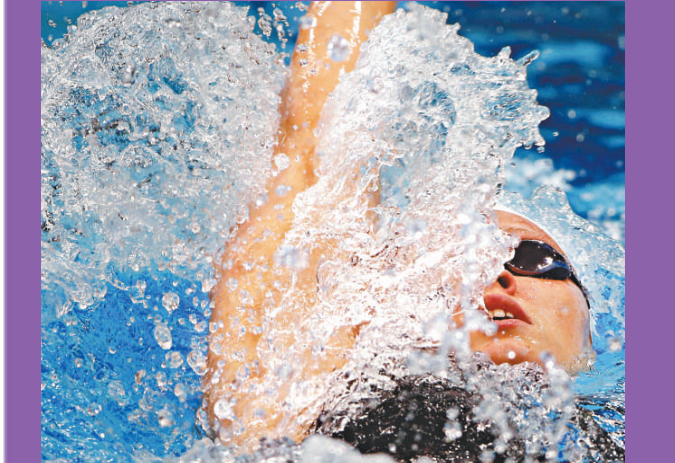
▲俄選手祖耶娃2日在200米仰泳中獲得銀牌