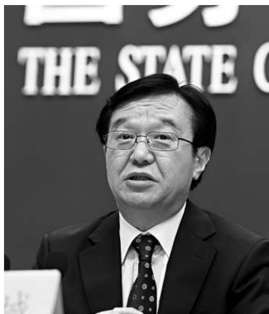
10日，商務部副部長高虎城稱，今年下半年外貿進出口的壓力會更大。

府將繼續保持相關政策的穩定，不斷改善政府服務，提高貿易便利化，支持企業進一步改善經營、擴大對外經營業務和市場開拓，爭取實現今年進出口增長10%左右的目標。