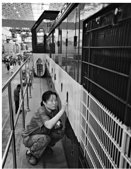
在出口商品中，機電產品出口增長較快。圖為一工人擦拭出口愛沙尼亞的調車機車。

【本報記者亮亮北京十日電】在全球金融危機背景下，中國與東盟貿易的快速增長具特殊意義。商務部副部長高虎城10日稱，在雙邊貿易規模不斷擴大的同時，中國與東盟的雙邊投資也快速增長。東亞地區持續保持經濟活躍和發展勢頭，特別是東盟各國吸引外資的不斷擴大，也為中國企業在上述國家和地區的投資提供了動力。