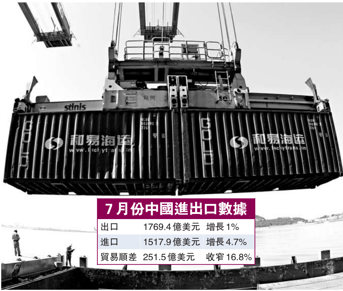
7月份當月，中國出口增速由6月份的11.3%陡降至1%。