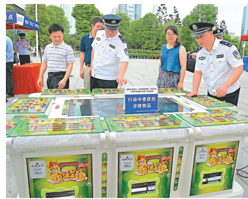
▲廣東警方公開展示查獲的賭博工具