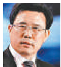
梁穩根 湖南三一重工董事長