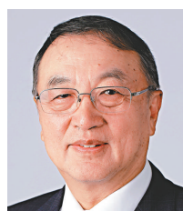
柳傳志 聯想控股董事長