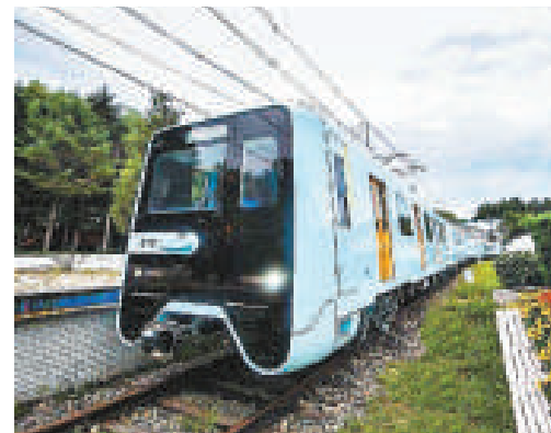
▲中國首款高寒地鐵列車將於8月底下線