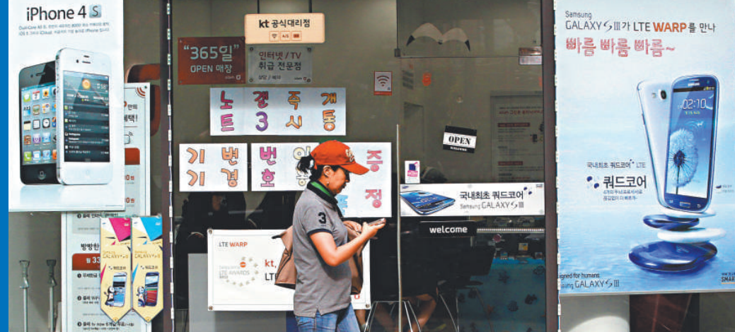
▲首爾一家手機零售店外貼着三星Galaxy 3 (右)和蘋果iPhone 4S (左)的海報

很多分析家相信，蘋果將於今年稍後推出迷你型iPad，亞馬遜則會推出升級版的Kindle Fire。微軟將於十月底推出其Surface平板電腦。台灣宏碁和華碩也打算推出使用微軟「視窗8」的平板電腦。