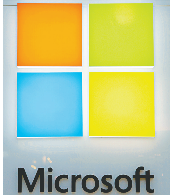
▲微軟新標誌由四個顏色不同的正方形組成

微軟準備於10月26日推出它的下一代作業系統Windows 8。微軟與芬蘭電訊巨頭諾基亞預期在9月5日，發布一種採用Windows Phone 8作業系統的智能手機。