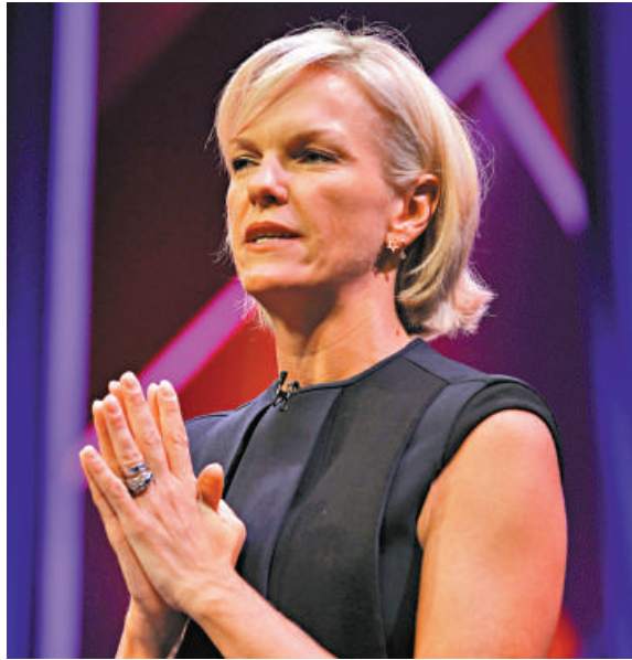
▲梅鐸女兒伊麗莎白23日在蘇格蘭發表演說