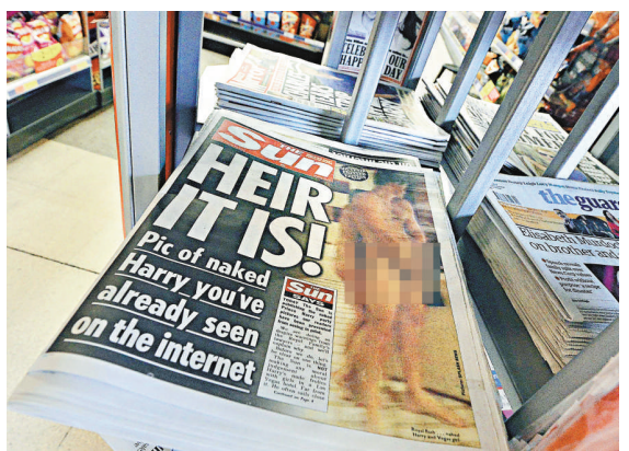
▲英國《太陽報》24日頂住王室壓力刊登哈里裸照

【本報訊】綜合美國TMZ網站、法新社24日消息：英國哈里王子裸照外泄的醜聞愈演愈烈。日前率先刊登裸照的美國八卦網站TMZ報道，哈里上周與一批女人在賭城拉斯維加斯酒店房間內開狂野派對時拍下的裸照，不光已經曝光的兩幅，在未來數天內，或會有更多見不得光的照片外流。