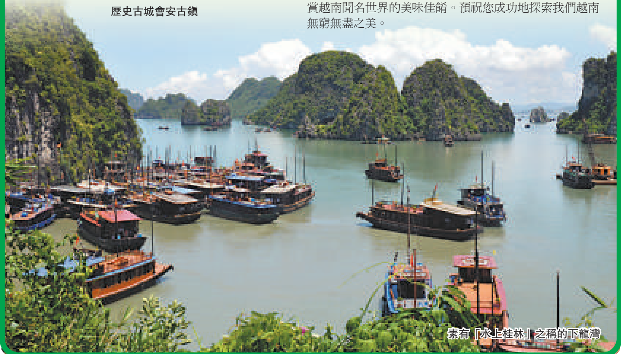
素有「水上桂林」之稱的下龍灣

到越南，您有機會觀賞越南秀麗迷人的世界奇觀，品嚐越南聞名世界的美味佳餚。預祝您成功地探索我們越南無窮無盡之美。