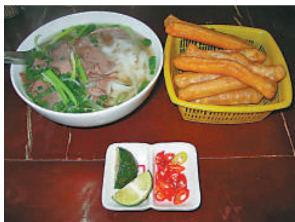
牛肉米線是越南著名美食之一

請您到越南，品嚐北部、中部和南部各具特色的大菜餚和小吃。您會永遠不會忘記越南價廉物美、味道獨特的米粉、春卷、南部牛肉米線、順化牛肉米線、煎餅等等。