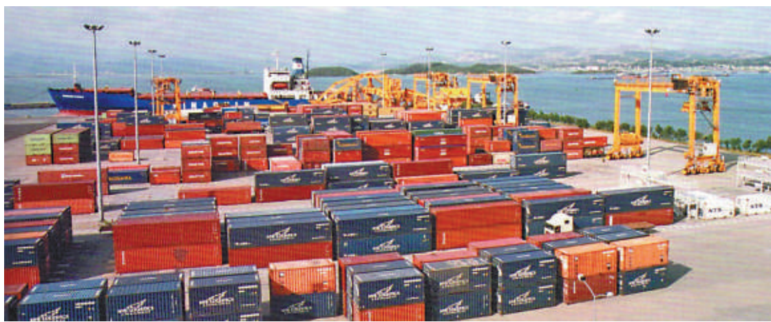
越南有良好的海港設施