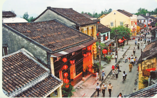
歷史古城會安古鎮

革新開放二十多年之後，越南以政治社會穩定、經濟持續快速增長、自然景觀秀麗迷人、人民慈祥好客、飲食多樣可口聞名於世。越南成為國際旅客安全、有趣的目的地。