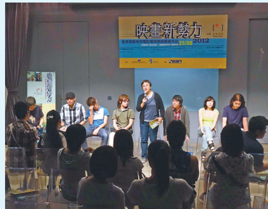
座談會上學生及導師分享創作心得