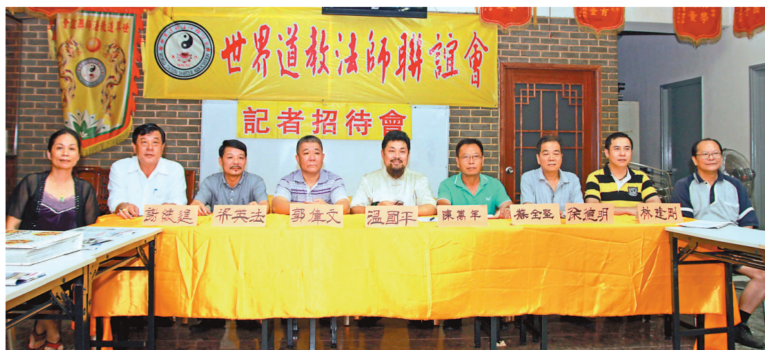
世界道教法師聯誼會介紹扶貧助學活動內容

世界道教法師聯誼會舉辦一年一度扶貧助學活動，今年將聯同澳門環保物料回收聯誼會於2012年9月11日至16日，前往廣西壯族自治區百色市隆林各族自治縣，扶持十間中、小學約100名學生（由500元人民幣至1200元人民幣不等）和貧困老師50名（每位老師1000元人民幣），贈送文具新華字典2000本分給十間學校，每間學校200本新華字典。所需的費用約30萬人民幣。