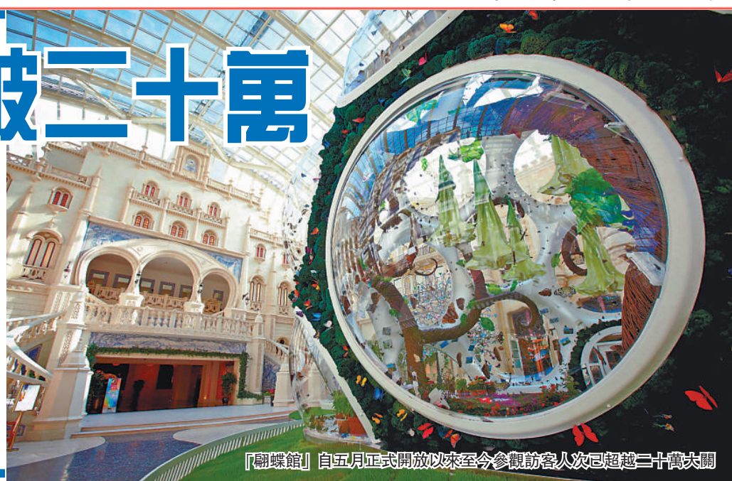
「蝴蝶館」自五月正式開放以來至今參觀訪客人次已超越二十萬大關

為推動愛護大自然的理念，「蝶舞翩跹」主題攝影比賽現正熱烈開展，並以每月一主題的形式進行。參賽者只需在Facebook 或新浪微博的「澳門美高梅」專頁分享與蝴蝶相關的個人攝影作品，邀請朋友「讚好」或轉發已上傳的作品，即有機會贏取澳門美高梅酒店餐飲住宿等豐富大獎！詳情請瀏覽澳門美高梅官方網站www.mgmcau.com。