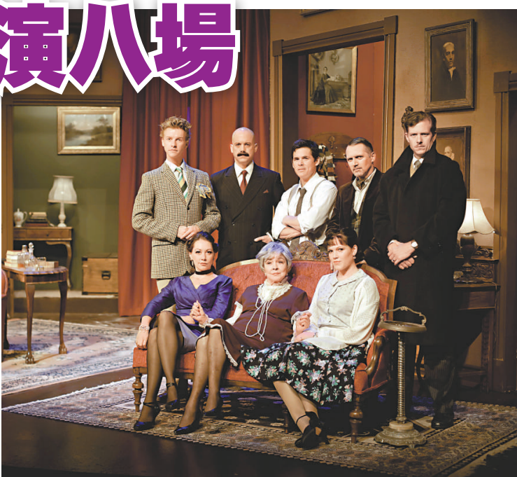
▲《捕鼠器》劇情幽默又驚險，故事發展曲折離奇

《捕鼠器》是「國際演藝嘉年華」其中一個表演節目，門票現於快速票公開發售，詳情可瀏覽 www.lunchbox-productions.com。