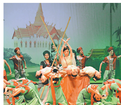
▲汕頭市澄海潮劇二團的《紅頭船》劇照

打金枝》及傳統粵劇《皇陵冤風》，參加第七屆中國映山紅民間戲劇節演出，分別獲得金、銀獎。