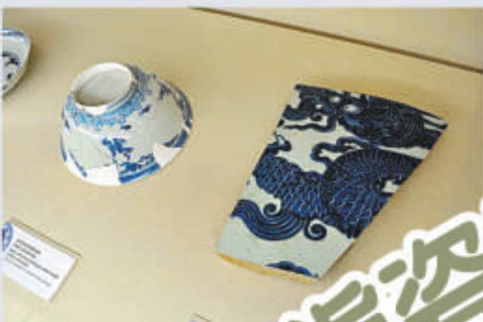
▲燒製青花大缸難度極大，圖為景德鎮御窯出土龍紋大缸殘片（右）