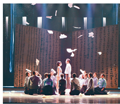
▲廣東省話劇院話劇《與妻書》劇照

江門市粵劇團將於九月十九日演出粵劇《霧鎖東宮十八年》，二十日演出粵劇《皇陵冤風》，二十一日演出粵劇《傳統折子戲》，地點是元朗劇院。江門市粵劇團已有五十多年歷史，重建於一九七八年。該劇團新編古裝粵劇《再