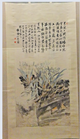
▲李禪的《土牆蝶花圖軸》

揚州到了清代已發展成東南沿海的大都會，經濟繁榮，文化藝術事業興盛，不少藝術家匯聚於此。不過當時畫壇以臨摹抄照為主流，缺乏生氣，力主創新的石濤提出「筆墨當隨時代」、「無法而法」的口號，他的理論和實踐