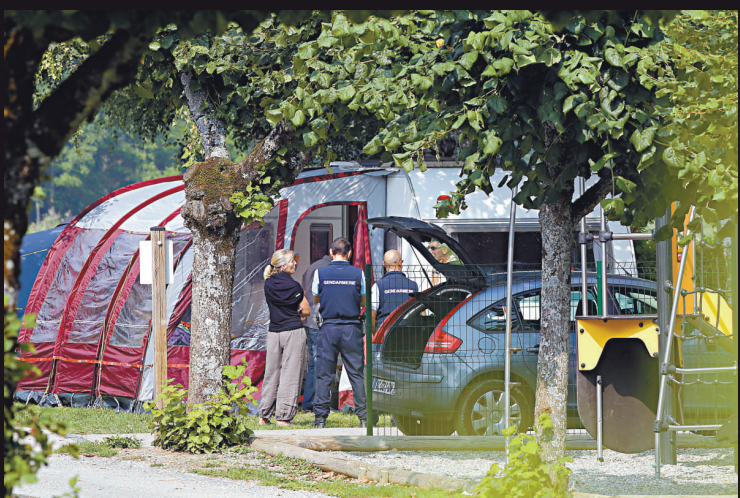
美聯社 ▲法國警方及調查人員站在被害英國家庭曾經住過的帳篷外