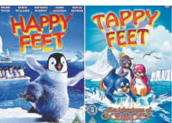
▲迪士尼動畫片《踢踏小企鵝》及其山寨片Tappy Feet的DVD封面對比

如今，迪士尼已經向牽涉其中的Brightspark製作公司發去警告信，指控該公司誤導消費者，並損害他們對迪士尼的信賴。Brightspark的總經理戴維斯則表示：「我們的電影更加便宜，一般都在3英鎊以下，為一些家庭提供廉價的娛樂享受。我很懷疑有人會把我們的電影和迪士尼的弄混。」