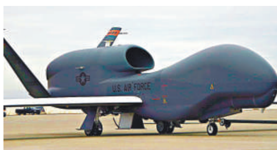
▲「全球鷹」無人偵查機

島」問題作出說明，更多的人則要求退還捐款。今年4月下旬，最先提出「購島」的石原，呼籲國民捐款支持東京都「購買」釣魚島行動。截至到5日為止，東京都政府共收到10萬餘人捐贈的14.6395億日圓（約1.45億港元）。