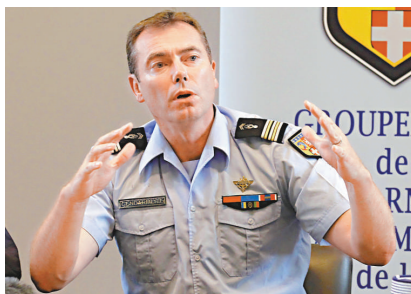
▲法國警方與被害英國家庭野營地點附近的人交談調查

槍殺事件最早於5日下午3時50分左右被揭發，數分鐘內當地警察趕至。但是警員沒有打開該輛彈孔累累的汽車車窗或車門，因擔心玻璃會破碎，破壞彈道專家的調查。