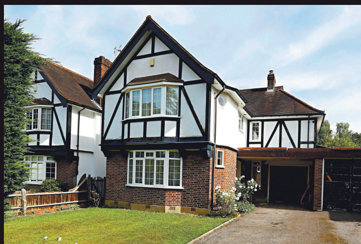
▲被害英國家庭位於薩里克萊蓋特的住宅