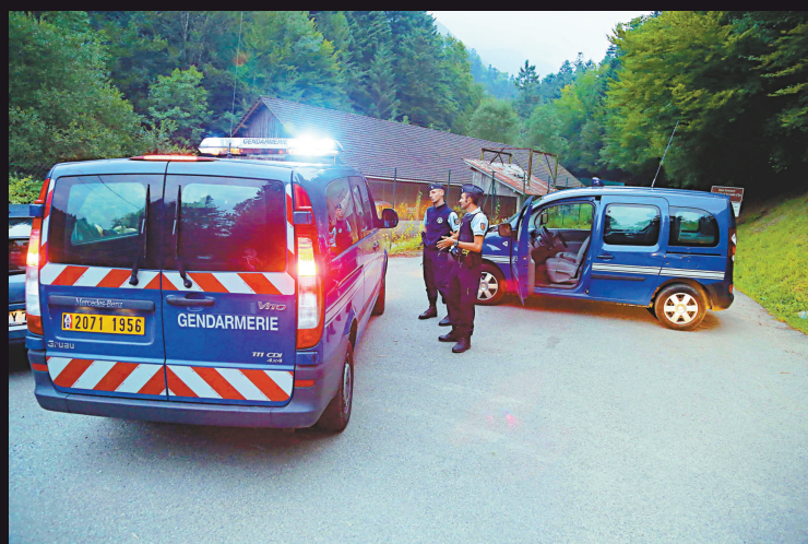
▲法國警方封鎖通往犯罪現場的道路