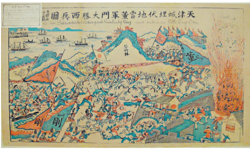
▲義和團繪製的圖畫

辛亥革命跨越百年之際，更多人關注並客觀評價那些在文化政治層面極富爭議的華洋人物、名臣志士。他們包括佔據中樞的滿清重臣；恪守傳統文化、心繫儒家經典的名賢碩儒；既不屈從共和政體，也不追隨革命黨人的晚清遺民。展覽展出李鴻章、張之洞、曾紀澤、梁啟超、李慈銘、馮儒、偉烈亞力、戈登等中外人士的兩百餘件文稿遺物，觀眾可透過兼容相輔的展品，更深入地了解晚清那個時代。