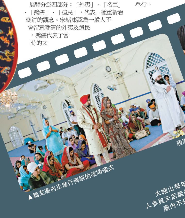
▲錫克廟內正進行傳統的結婚儀式