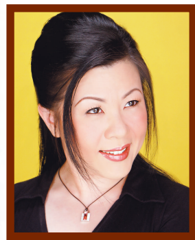
女高音歌唱家阮妙芬