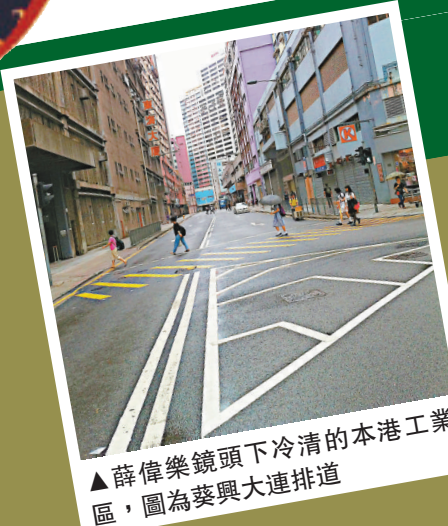
薛偉樂鏡頭下冷清的本港工業區，圖為葵興大連排道

隨着香港經濟發展由第二產業(工業)轉型至第三產業(服務業)，從事電子工程業的攝影師薛偉樂親歷本地工業由盛轉衰，感慨的同時，亦觀察到一幢幢已完成任務的工廈正處於面臨巨變的前夕，他決定帶着智能手機遊走香港各個工業區，把眼前的「末代工廈」記錄下來，見證香港經濟轉型之下，工業區冷清、疏離和蕭條的一刻。