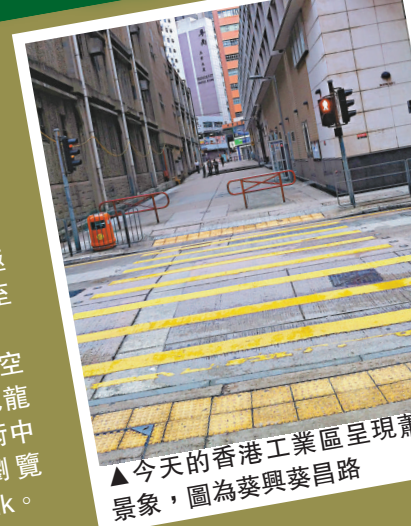
今天的香港工業區呈現蕭條的景象，圖為葵興葵昌路

隨着香港經濟發展由第二產業(工業)轉型至第三產業(服務業)，從事電子工程業的攝影師薛偉樂親歷本地工業由盛轉衰，感慨的同時，亦觀察到一幢幢已完成任務的工廈正處於面臨巨變的前夕，他決定帶着智能手機遊走香港各個工業區，把眼前的「末代工廈」記錄下來，見證香港經濟轉型之下，工業區冷清、疏離和蕭條的一刻。