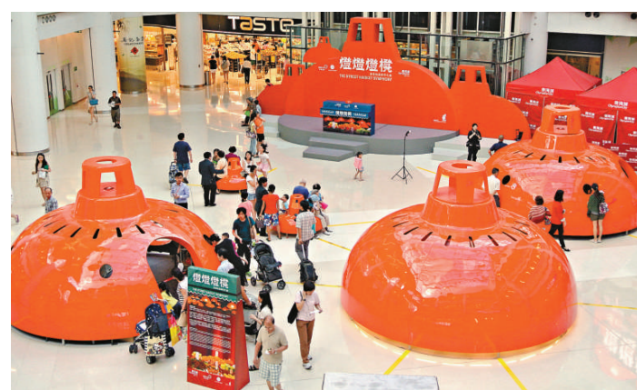
大型街市燈展覽場

此次香港地道街市之旅「燈燈燈機」展覽現正於奧海城二期地下主題中庭舉行至十月二十三日，詳情可瀏覽網站 www.lympiancity.com.hk。