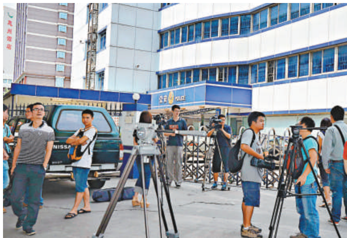
▲大批傳媒14日仍然在事發警局外守候

同時，羅湖另一參加急救的醫護人員向本報記者透露，當時她正下樓，一名警員確定死亡已拉走，另一名警員除了腹部的嚴重刀傷，頭部太陽穴有一個致命的槍傷。據一名在深圳養老的香港退休警察受訪稱，綜合現有的證據分析，一名警察蓄意殺害同袍後自殺的可能性較大。