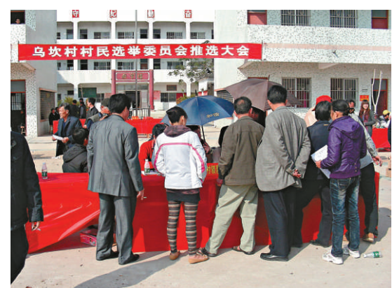
▲烏坎事件等被選為去年度中國社會管理創新十大事件之一

四是彌補信仰的缺失。隨着社會經濟的快速發展和轉型，原有的社會道德觀念和價值體系逐步缺失，重建社會核心價值體系成為社會建設長期而艱巨的任務。