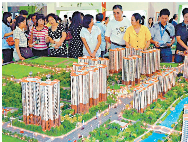
▲廣州下半年將增加住宅用地供應，其中住宅用地與商業用地比例將達一比一