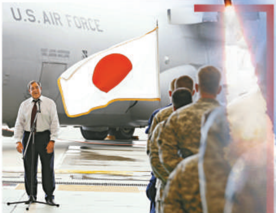
▲美國國防部長帕內塔17日在橫田空軍基地接受美軍士兵提問 路透社