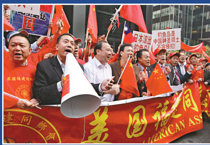
▲9月16日，華盛頓地區近300名華人華僑在日本駐美大使館門前舉行「勿忘九一八，保衛釣魚島」示威遊行