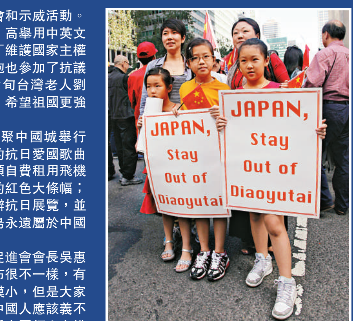
▲16日在日本駐紐約總領館外抗議的美國華人家庭