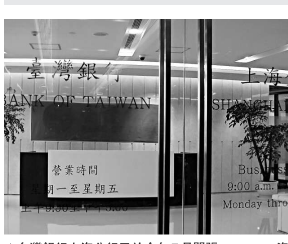
▲台灣銀行上海分行已於今年7月開張 資料圖片

【本報訊】綜合中通社及中央社十七日報導：兩岸貨幣清算機制在兩岸簽署合作備忘錄（MOU）之後，即將運作，台灣地區「中央銀行」近日遴選在大陸的新台幣清算行，17日宣布結果，由台灣銀行的上海分行雀屏中選。「央行」表示，後續仍要等待人民幣清算行出列，島內外匯指定分行才能進行人民幣業務。 「海峽兩岸貨幣清算合作備忘錄」已於今年8月31日完成簽署，並經台灣行政部門於9月6日核定。為了具體落實備忘錄共識，台灣「央行」7日火速訂出新台幣清算行遴選辦法並受理申請。在大陸地區設有分行的台灣10家銀行中，有8家依規定時間送件提出申請。 經遴選小組分別與8家銀行負責人面談，審視其外匯指定銀行及大陸分行文件、財務報告及自評