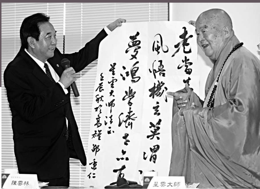
▲海協會會長陳雲林（左）17日參訪佛陀紀念館，星雲法師（右）贈送佛陀館書畫給陳雲林；陳雲林回贈法師一幅字畫

正在台灣訪問的大陸海協會會長陳雲林，17日上午到達高雄佛光山佛陀紀念館參訪，佛光山開山宗長星雲法師在致詞中提到近日熱點話題「釣魚島主權問題」，星雲表示：「釣魚台是我們中國的」，認為兩岸乃至全世界華人都應在「保護國家、護土人人有責」的原則上緊緊團結。