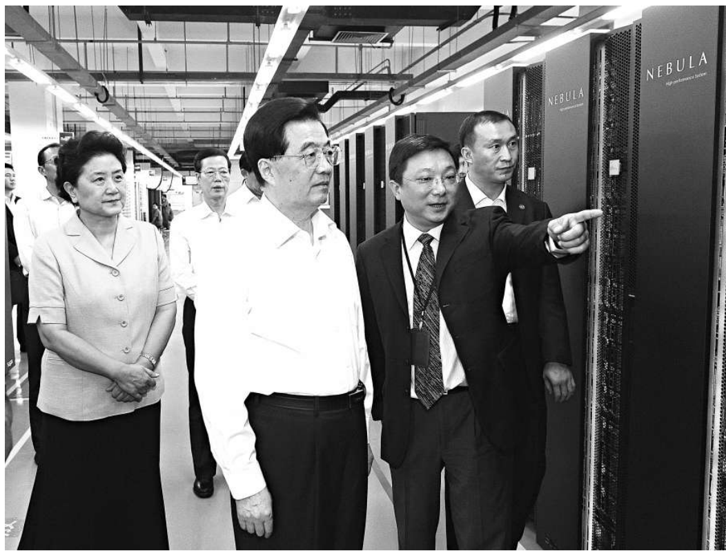
▲國家主席胡錦濤18日在天津曙光信息產業公司考察，了解高性能計算機的研發、生產情況。

胡錦濤強調，實現創新驅動發展，最關鍵的是要促進科技與經濟緊密結合。他希望曙光公司堅持走中國特色自主創新道路，把握經濟社會發展需要，瞄準世界信息技術發展前沿，加大研發力度，加快成果轉化，努力推出更具技術優勢和市場優勢的高性能計算機，為推動中國信息化建設貢獻更大力量。