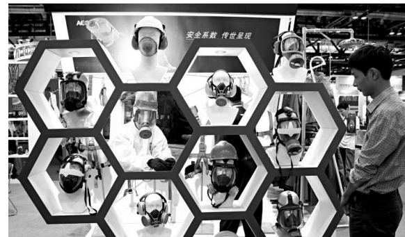
▲第六屆中國國際安全生產及職業健康展覽會18日在北京舉行。會場裡展示煤礦井下安全避險控制系統、工業安全動態監控及預警預報系統等技術裝備。圖為參觀者在展會上觀看個人防護用品。新華社

今年8月25日，三沙市永興島污水處理及管網工程、西沙群島垃圾收集轉運工程同時動工建設，兩個項目共投資5000多萬元，建成後可實現日轉運垃圾能力20噸，日處理污水能力1800噸，基本符合西沙軍民的需。另一個生態環境保護項目是有關島嶼海岸整治修復與保護工程，於9月14日開工建設。（新華社）