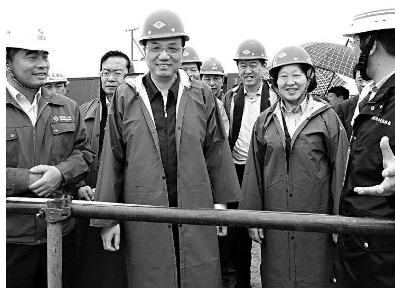
▲去年五月，國務院副總理李克強（前排左二）在福建省委書記孫春蘭（前排左三）、省長蘇樹林（二排左一）的陪同下視察了平潭島。

應福建省政府新聞辦公室的邀請，來自17個國家和地區的22家海外華文媒體的29名記者，18日開始了在閩6天5個地級城市的採訪行程，首站就是當前平均一天投資一個億超速度發展的平潭（對台）綜合試驗區。如今，站在這個大陸距離台灣本島最近的島嶼上，每一個人都可以明顯地感受到它在中央和閩省高層心目中的特殊地位和超乎想像力的前進速度。本報記者 蔣煌基報道