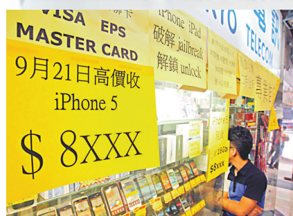
▲有水貨店貼出 iPhone 5 回收價