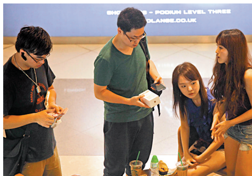
◀大批炒家即場「收機」搶貨