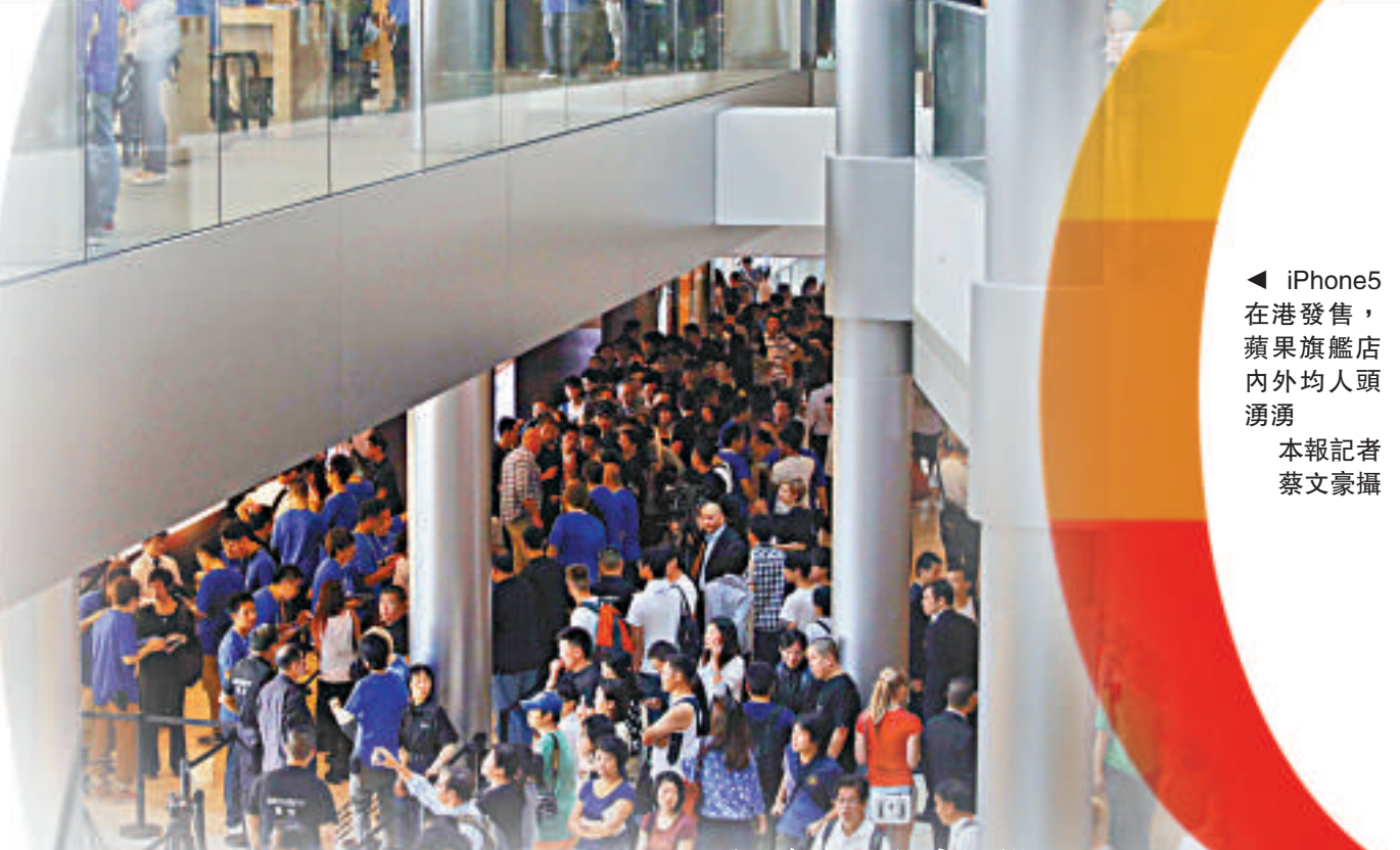
◀ iPhone 5 在港發售，蘋果旗艦店內外均人頭湧湧

對於 iPhone 5 掀起的炒風，G-WORLD MOBILE 負責人劉志剛認為，在貨量供應充足下，今次炒期僅約一個月，稍後價錢將慢慢回落，「有別於 iPhone 4 及 4S 可以炒成年，當時不但內地需求大，而且並非太多國家同步發售，所以顯得較矜貴。」