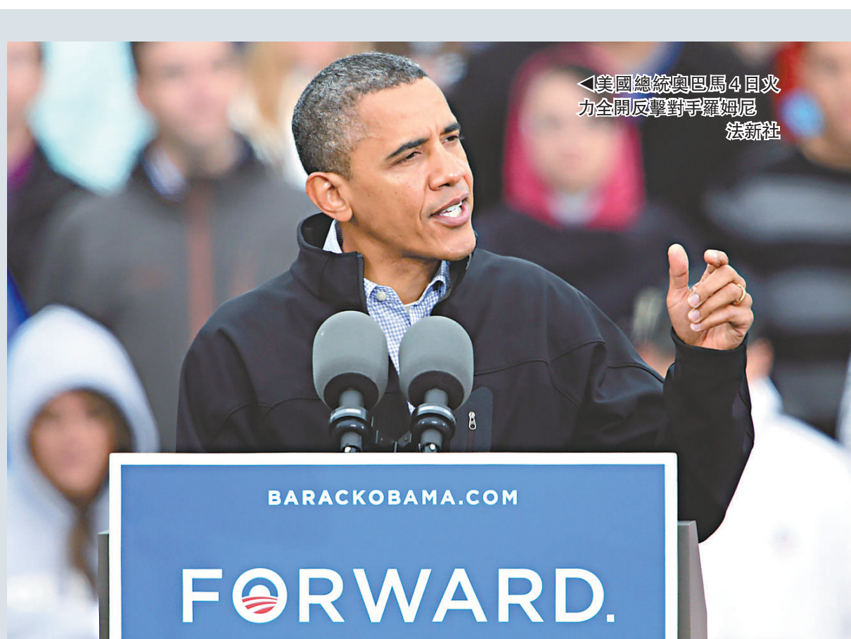
◀美國總統奧巴馬4日火力全開反擊對手羅姆尼 法新社

阿克塞爾羅德說，說奧巴馬不大可能「花大量時間去做準備」。奧巴馬的戰略，包括抨擊羅姆尼在辯論中談論稅務計劃、保健和削減赤字時說不誠實的話，以及抨擊他在銀行管制方面似乎也改變立場。高級顧問戴維·普盧夫說：「鑑於羅姆尼不誠實，因此我們必須調整戰略。美國政治史上，似乎沒有一位重要的總統候選人像他這樣，如此不誠實地對待自己的競選政綱。」