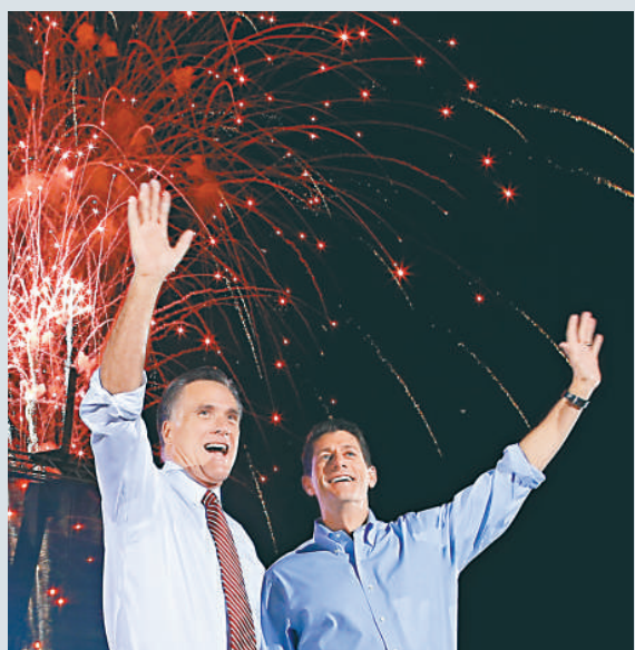
▲羅姆尼與副手瑞安4日在弗吉尼亞州的造勢活動上

羅姆尼競選陣營發言人稱，羅姆尼8日還將就外交政策和國家安全問題發表演講，地點安排在大選搖擺州的佛吉尼亞軍事學院。