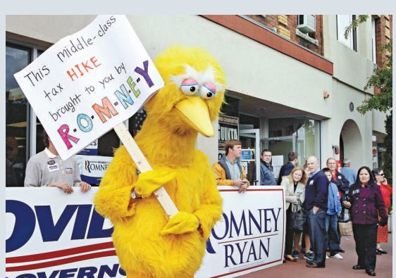
▲8日在新罕布爾州，一名羅姆尼的反對者打扮成大鳥示威

白宮和奧巴馬的競選團隊都拒絕對高盛的捐資行為發表評論。高盛改變支持對象的舉動反映出，金融服務業正在更大範圍內發生一場改變所支持陣營的行動，金融業曾經是民主黨最主要的競選資金來源。摩根大通、花旗集團、美國銀行、摩根士丹利和高盛是美國五家在政治上很活躍的銀行，其員工在2008年總共向奧巴馬捐資350萬美元。而在2012年的總統選舉中，他們給予奧巴馬的捐款只有65萬美元，給予羅姆尼的捐款則達330萬美元。