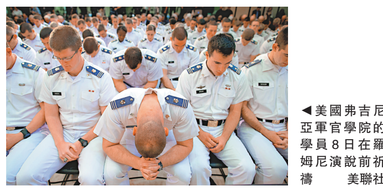
▲美國弗吉尼亞軍官學院的學員8日在羅姆尼演說前祈禱

儘管皮尤研究中心的這次民調顯示羅姆尼的支持率獲得顯著提高，但民調結果也顯示羅姆尼和奧巴馬的支持率依然非常接近。他們在登記選民中的支持率勢均力敵。