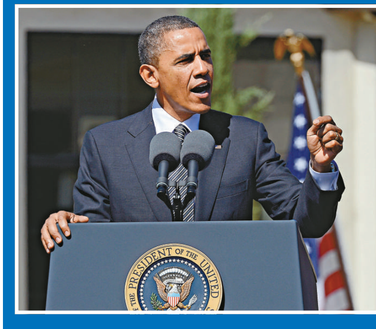
▲美國總統奧巴馬8日在加州演說拉票