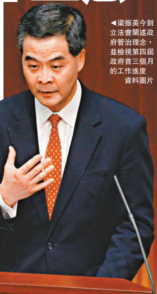
▲梁振英今到立法會闡述政府管治理念，並檢視第四屆政府首三個月的的工作進度 資料圖片

梁振英上任已一百多天，他所帶領的政府因應社會訴求，不斷推出各項措施，以求解決房屋、扶貧、安老等積累多年的問題，爭取市民信任。政府上任後立刻落區，其後推出二千二百元長者特惠生果金和無障礙措施，推出短中期的房屋政策，又在短時間內有效處理上水水貨客問題。開局不易，梁振英上任一百天會見傳媒時形容自己正是接手「一盤攪開的棋局」，強調今屆政府正努力解決香港積存多年的問題。