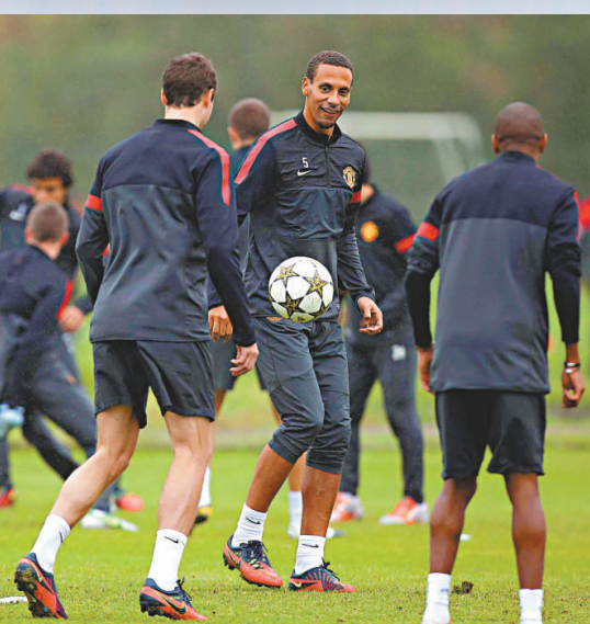
▲據說里奧(右二)被費格遜處以罰款嚴懲

不過，《每日郵報》就有另一版本，指費格遜與里奧面談後，費爵爺已接受里奧的解釋，只告訴里奧以後有任何想法，應該先通知自己。此外，英球員工會未有怪責里奧，表示里奧也有其言論自由。