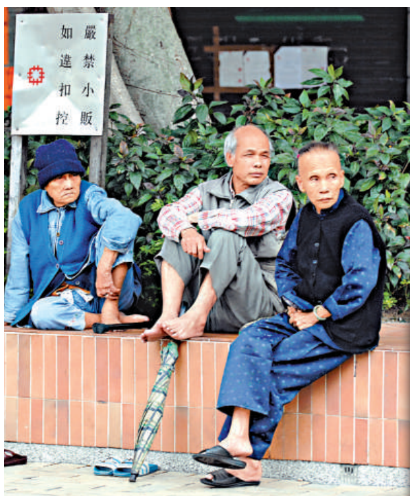
▲長者生活津貼關乎近四十萬名長者的福祉，政府認為，愈遲通過撥款，長者損失愈大

勞工及福利局局長張建宗表示，星期一會出席福委會的長者生活津貼公聽會，會後亦會再與議員商討，爭取在星期二的特別財委會上通過撥款。張建宗重申，計劃是為長者福祉為出發點，已無空間再押後，