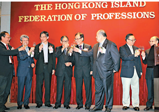
▲香港專業人士聯會昨日舉辦座談會

【本報訊】香港專業人士聯會昨日舉辦座談會，鼓勵香港各專業服務界充分利用CEPA（內地與香港關於建立更緊密經貿關係的安排），抓住時機拓展內地市場，並為內地企業走向國際服務。