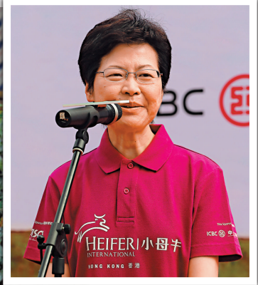
▲林鄭月娥懇請議會以有需要長者利益為前提，盡快於今個月內通過撥款申請

行政會議召集人林煥光說，不明白為何現時民意清晰，立法會仍有議員要求延遲或押後撥款，他了解社會上有聲音要求政府解決長者貧窮問題，但應以先易後難的方式，先通過長者生活津貼撥款，然後成立專責委員會，研究長者貧窮問題。他希望議員尊重大部分市民的意願，盡快通過撥款。至於津貼追溯期，他指出政府長久以來有嚴格的理財準則，不可隨便改動。