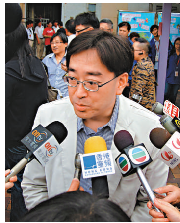
▲高永文表示，衛生署有合適人選接替曾浩輝

【本報訊】食物及衛生局局長高永文表示，食物及衛生局副局長一職已有目標人選，可能會於本周公布，又說衛生署有合適人選接替即將離任的衛生防護中心總監曾浩輝的空缺，但遴選程序仍在進行中，料需時一個月完成。