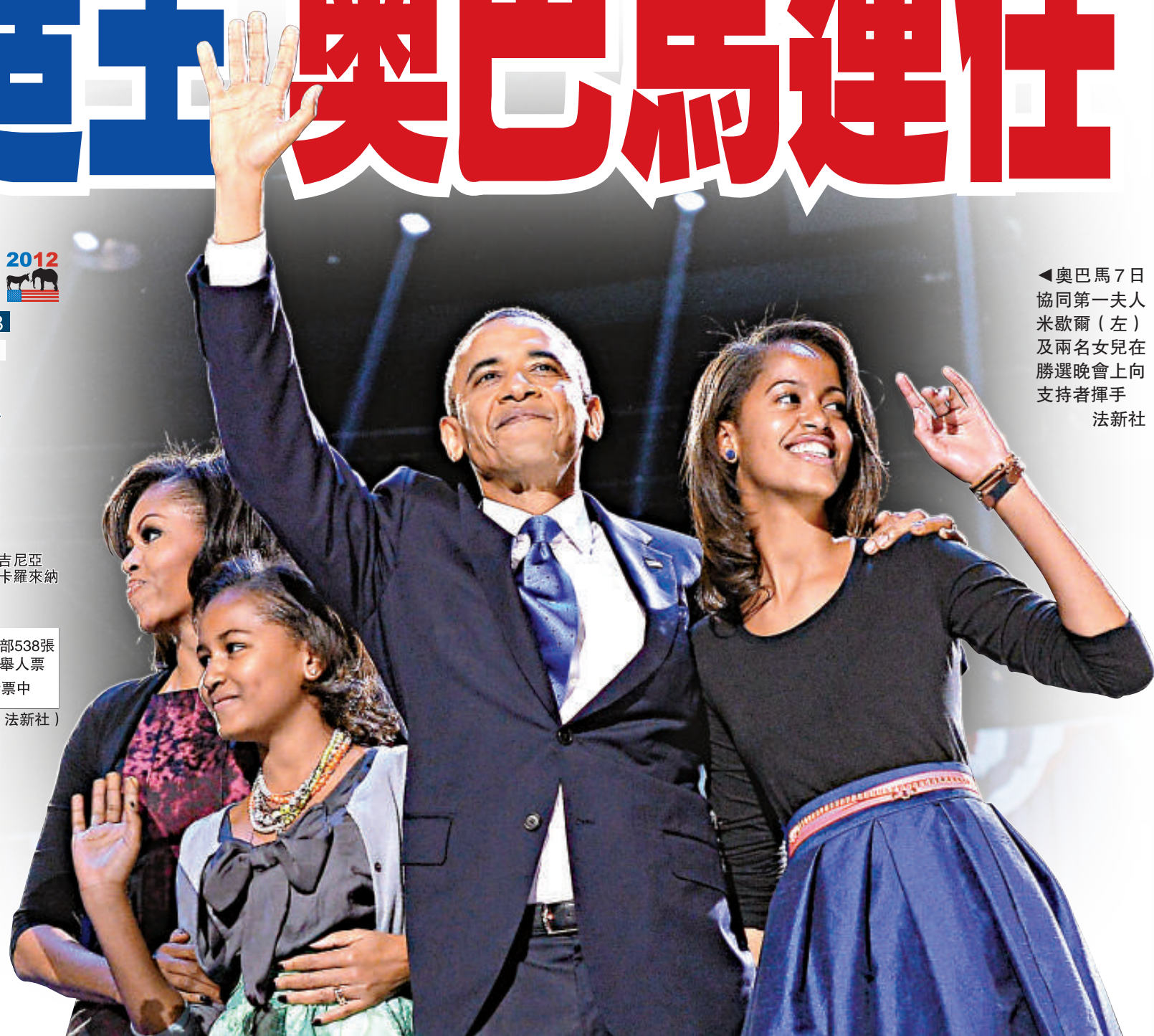
◀奧巴馬7日協同第一夫人米歇爾(左)及兩名女兒在勝選晚會上向支持者揮手