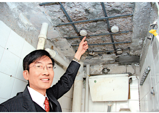
▲有滲水個案投訴被拖近四年，食環署竟一直不作紀錄及跟進 資料圖片

【本報訊】記者李盛芝報導：審計報告批評食物環境衛生署，處理公眾查詢及投訴有不足之處，抽查滲水報告發現80%長期沒採取行動，平均拖延44個月，有個案投訴被拖近四年，食環署竟一直不作紀錄及跟進。 食環署在本年度接到18.7萬宗市民投訴，審計署抽查最近十宗滲水投訴個案發現，八宗在食環署調查過程長期沒採取行動，個案涉及沒採取行動時期由14至57個月不等，平均為44個月，嚴重超出署方的服務承諾，審計署形容為不能接受。 其中一宗滲水投訴發生於2007年6月，投訴人指單位有滲水問題，食環署接報後三年也沒行動，也沒將個案作記錄，直至投訴人在2010年7月致電查詢進展時，署方才重新跟進，但調查進度龜速，「開始」跟進事件後一個月才上門量度牆身含水量，再花兩個月查找滲水原因，拖延至今年四月底，食環署想再聯絡投訴人，才驚覺事主已搬走，整宗個案前後拖延近四年，在未有解決下結束。 審計署並抽查食環署30宗投訴個案，驚訝20宗未有履行於十天內回覆查詢和投訴的承諾，即使個案解決，有個案在記錄冊上仍然寫上「未解決」。食環署各分區辦事處亦有管理不善問題，不同辦事處在處理投訴時做法不一，有很多涉及小販個案仍未記錄在案。 針對個別長期未有採取行動的個案，食環署歸咎於人手短缺，以非公務員合約聘用調查員經常流失。署方已提供高級衛生督察及衛生督察職位，取代調查員，減少流失率。審計署建議，食環署應檢討投訴管理資訊系統的數據準確性，改善該系統所編制的管理資料的可靠程度。 審計署認為，食環署應提醒行動單位，妥為備存所有服務要求及投訴檔案，密切監察久未解決的服務要求及投訴個案，查找個案需時完成的原因，找出改善之處。 至於署方的投訴管理組，應檢討監督食環署的公眾查詢，及投訴方面的角色和編制，以確保能迅速及有效地跟進尚未解決的服務要求和投訴個案。食環署表示，同意審計署上述建議。