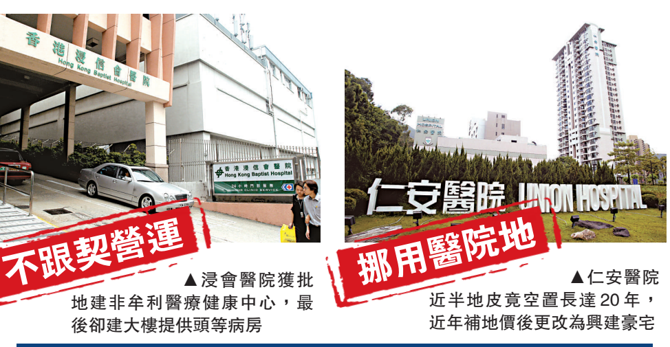
▲浸會醫院獲批地建非牟利醫療健康中心，最後卻建大樓提供頭等病房 ▲仁安醫院近半地皮竟空置長達20年，近年補地價後更改為興建豪宅