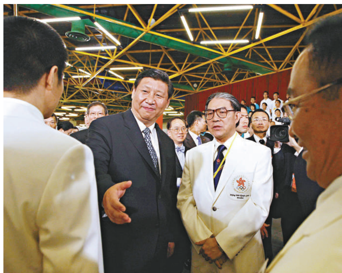
▲習近平08年7月訪港時，視察奧馬比賽場地，主動與港運動員握手，盡顯親民作風

由於長期在廣東工作，張高麗與香港媒體一直保持良好關係。在他調任天津市委書記後，他還曾於2009年和2012年兩次會見《大公報》高層一行，感謝《大公報》對促進津港合作所做的積極努力。