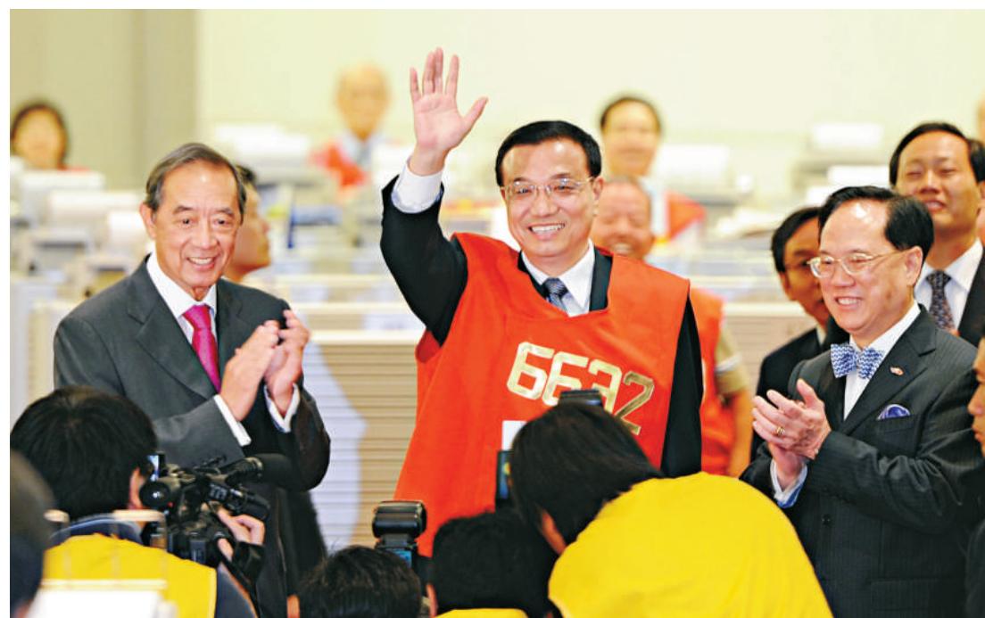
▲李克強去年年中帶來「挺港36條」措施。圖為他參觀香港交易所