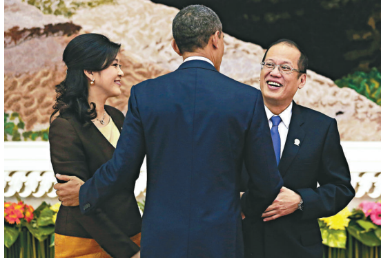
▲奧巴馬（中）20日在東亞峰會上和菲律賓總統阿基諾三世（右）以及泰國總理英拉（左）握手

【本報訊】據《華盛頓郵報》20日報道：奧巴馬致力於與多個中型亞洲國家擴大貿易，美其名曰增加美國職位和出口，但其實還有一個更大的目標：迫使中國加快開放其經濟和抑制中國在經濟上的某些影響力。