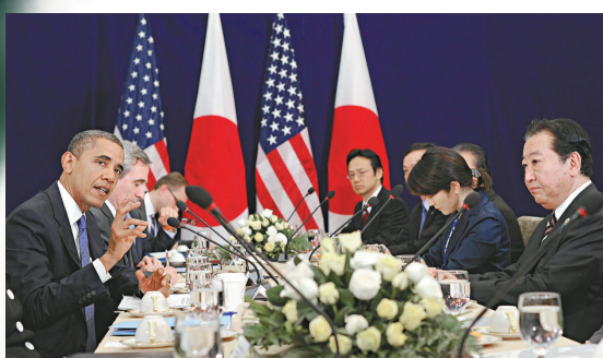
▲美國總統奧巴馬（左一）和日本首相野田佳彥（右一）20日舉行雙邊會談

【本報訊】據中央社東京20日消息：美國總統奧巴馬20日與日本首相野田佳彥在東埔寨金邊舉行雙邊會談。野田在會談中提及釣魚島問題，並表示盼加速與美國討論有關加入跨太平洋夥伴協議（TPP）協商。