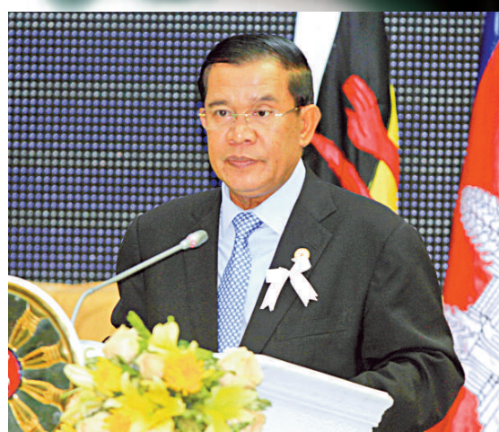
▲東埔寨總理洪森20日在東盟峰會閉幕式上致辭

【本報訊】據路透社、法新社、共同社、《華爾街日報》金邊20日消息：美國總統奧巴馬20日出席東亞峰會，在峰會上不顧中國的抗議將領土爭端問題擺上桌面，插手亞洲領土糾紛。菲律賓和越南也從中攪局，否認此前宣布的關於南海問題的共識，引發東盟內部緊張關係。