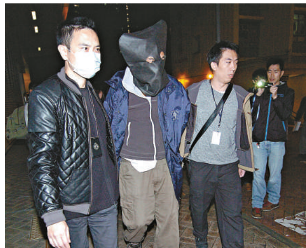
▲ 涉偷走多本警員簽到簿的老翁被捕

連同昨日案件，科大過去9日已發生3宗儲物櫃失竊案。在本月20日及前日，先後有兩名男女學生在學術大樓的儲物櫃被爆竊，損失手提電腦，分別值1萬元及6,000元。