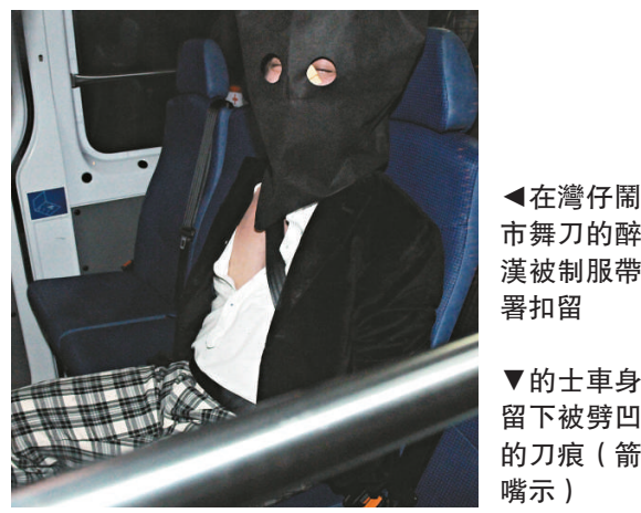
◀ 在灣仔鬧市舞刀的醉漢被制服帶署扣留

狂漢持刀對峙不久，終於自行棄刀在地，警員見狀立即上前將他按倒地上制服，拘以藏有攻擊性武器及刑事毀壞罪；事件僅一場虛驚，幸無人受傷。灣仔警區反黑組第二隊已接手案件，疑犯背景有待調查。