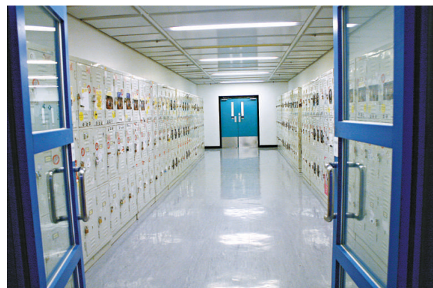
▲ 科大校園的儲物櫃接二連三被賊人搗毀爆竊

警方接報後展深入調查，昨日上午10時許，與入境處人員聯合行動，突擊搜查油麻地廟街及砵蘭街4個單位的「劏房」，共拘捕10名涉嫌賣淫女子，年紀最大竟達57歲，全部被帶署扣查，轉交入境事務處跟進，打擊行動仍繼續進行。