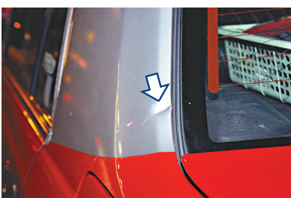
▼ 的士車身留下被劈的刀痕（箭嘴示）