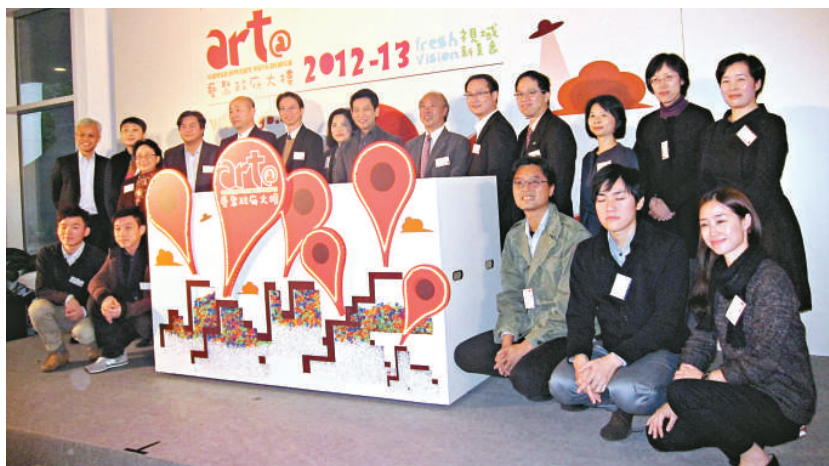
▲昨日出席開幕禮的嘉賓與藝術家合照