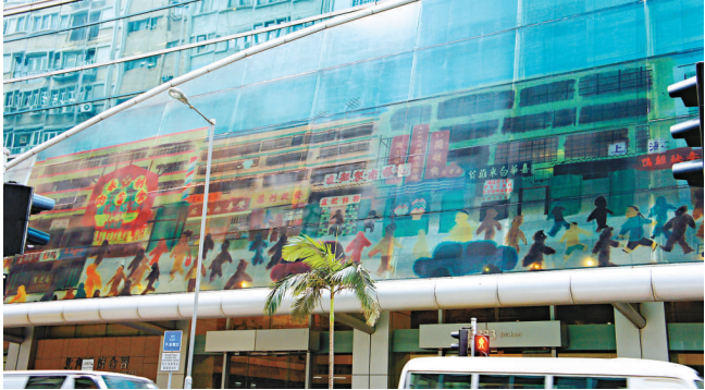
▲麥震東為北角政府合署所畫的作品，突出了傳統招牌上的書法