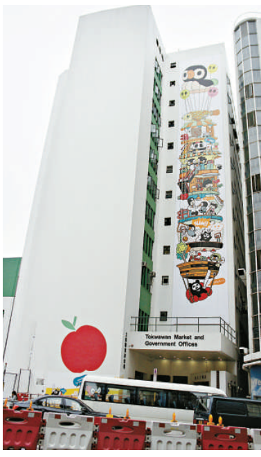
▲「江記」為土灣市政大廈創作的牆上，有他筆下的漫畫角色

上述作品可讓市民免費參觀，作品附近的服務站能播放作品資料，上有盲人點字及作品物料讓殘疾人士觸摸，另外大會設有導賞團介紹創作特色，詳情可登上網 www.agb.hk ，或電六七七八七二三，資料單張於各區政府大樓備索。