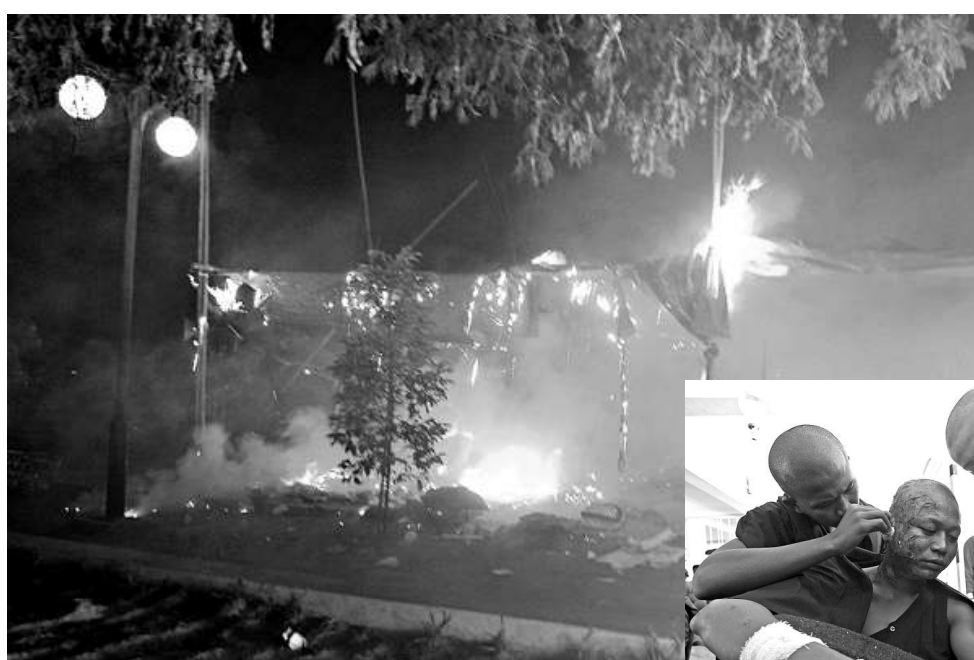
▲萊比塘銅礦區的一個示威營29日在警方的示威清場行動中着火

【本報訊】綜合路透社、美聯社、法新社、《紐約時報》29日消息：緬甸數百名村民、學生和僧侶連續數日佔據北部蒙育瓦中緬合資銅礦區抗議徵地後，緬甸當局周四清晨出動鎮暴警察清場，向示威群眾發射水炮和催淚彈，導致數十人受傷。這是現任總統吳登盛上台20個月以來，最大規模的示威清場行動。