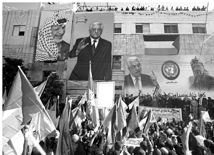
▲約旦河西岸巴勒斯坦民眾29日舉行集會，希望本國可以順利入聯

【本報訊】綜合美聯社、法新社29日消息：第65屆聯合國大會於紐約時間29日下午三點（香港時間30日凌晨4點）表決巴勒斯坦尋求從政治實體觀察員提升至觀察員國地位的決議草案。在投票表決前夕，美國態度強硬，再次重申會投反對票。 巴勒斯坦自治政府主席阿巴斯將在29日下午，正式向聯合國193個成員國提出，讓巴勒斯坦升級成為聯合國正式觀察員國，並就巴以關係發表關鍵演說。 當天的決議只需要獲得簡單多數通過，預計巴勒斯坦可以獲得150票。巴勒斯坦稱，已有132個國家與巴勒斯坦互相承認國家地位，但不排除部分國家投票棄權的可能。另外，像法國等部分歐洲國家，儘管沒有正式承認「巴勒斯坦國」，但還是會投票支持。 作為以色列堅定盟友的美國，一直大力開展各種攻勢，阻礙巴勒斯坦這次的申請，並警告稱巴勒斯坦地位升級，對於解決中東長達數十年的衝突沒有任何幫助。 28日，美國國務卿希拉里在議案投票前夕強調，通往巴勒斯坦建國的唯一道路是直接協商。 希拉里說：「我已說過很多次，實現巴勒斯坦人民渴望、通往兩國方案的道路，是經由耶路撒冷和拉姆安拉，而非紐約。」希拉里重申美國反對巴勒斯坦在聯合國尋求地位升級，明確表示美國會投反對票。 希拉里警告，不論當天聯合國表決結果如何，「都無法產生所有人想要的結果，獲致長久解決方案的唯一方式，是展開直接協商。」 美以撤援助脅迫 無功而返 美國助理國務卿伯恩斯和中東特使黑爾，28日在阿巴斯下榻的酒店與其會面，