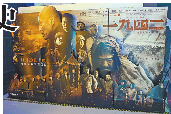
▲描述河南大饑荒人們逃難故事的電影《一九四二》，29日在內地公映。圖為該劇海報。