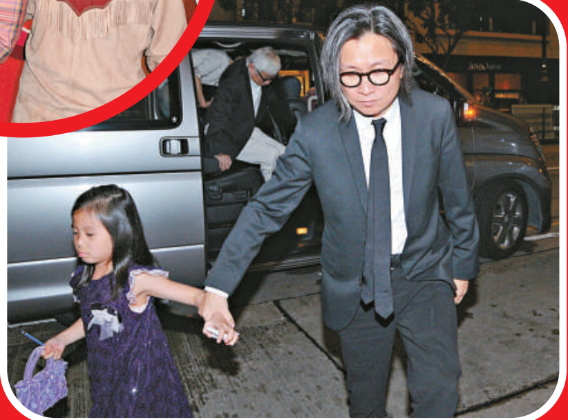
▲君如踢爆丈夫陳可辛(右)只會跪拜女兒 ▼邱淑貞(左)出席陳可辛生日派對，否認懷孕