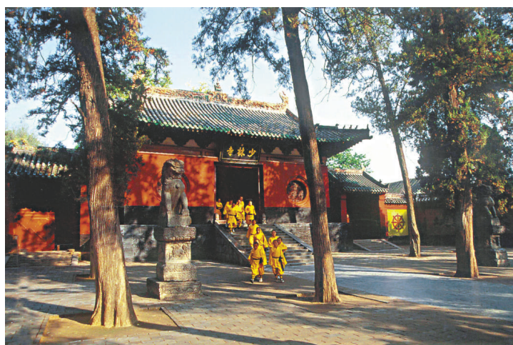
▲少林寺是佛教禪宗祖庭

近年來，登封立足文化旅游資源優勢，深入貫徹落實科學發展觀，以文化提升旅遊內涵，以旅遊擴大文化傳播和消費，突出發展文化旅游產業，加速