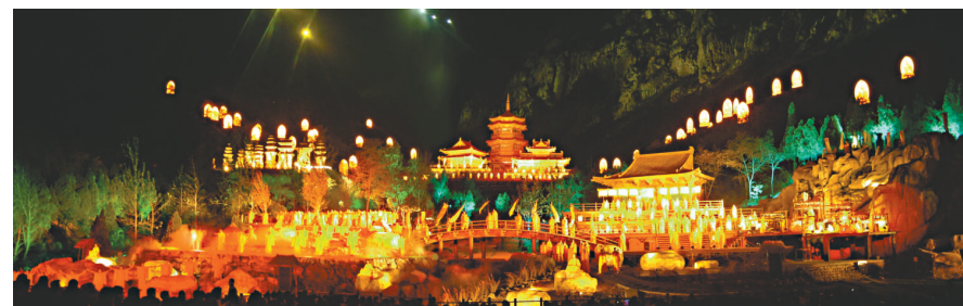
▲《禪宗少林·音樂大典》實景演出是河南省文化旅游的一面旗幟

登封新區將建成為集休閒、居住、商貿等功能於一體的現代化城市新區。該區位於老城區東，建成區面積達3.5平方公里，人口3.1萬，規劃面積30平方公里，規劃人口22萬人，要着力打造產業集聚區、居住區、中岳文化苑三大板塊。其中，產業集聚區板塊要重點發展機械裝備製造及零部件加工業；居住區板塊要重點發展生態宜居、文化旅游休閒和現代服務業；中岳文化苑板塊要突出展示中岳嵩山文化、中原民俗文化，形成綜合性文化產業園。