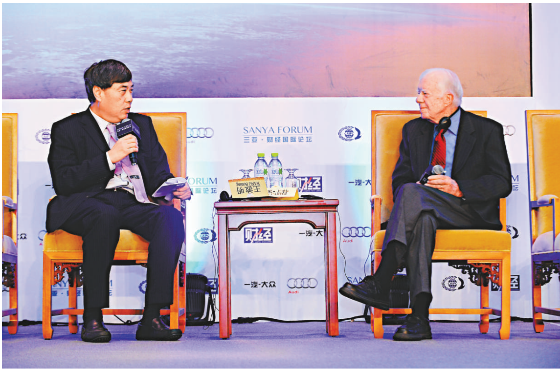
▲美國前總統吉米·卡特（右）16日在「三亞·財經國際論壇」與嘉賓討論中美關係和中國在世界的地位

在談及中美關係近期出現緊張局勢時，卡特表示，兩國要互相理解、尊重彼此存在的分歧、不干涉各自的決策。中美之間的基本問題是在能否尊重彼此的不同點。 卡特還指出，兩國的經貿、教育、文化的交往越來越緊密。這意味着可以和平、互惠互利的方解決問題。「美國領導人和中國領導人一樣明智，因為他們知道中美之間有貿易、學術交流、旅遊等等，這對於兩國都非常重要」，卡特據此對中美關係未來充滿信心。 對於有分析認為，美國經常避免談到中國在亞洲的重要性，而且在美國大選前還有各種攻擊中國的言論，卡特表示，他本人很討厭攻擊中國的言論，但很不幸，這就是美國政治生活運轉的一部分，幸好選舉結束後，這些言論會自動消失。 卡特對中國南海近期出現的緊張局勢表示擔憂。他希望中日新一屆領導人和平解決釣魚島問題，雙方應達成「共同擁有這個島嶼但不會佔領它」的共識。