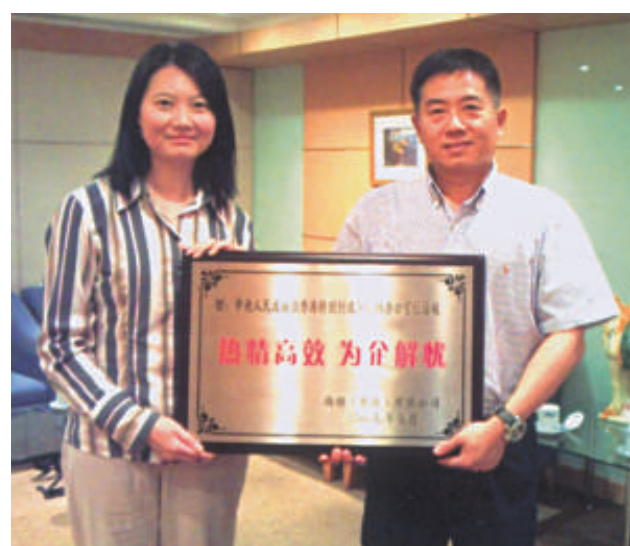
▲張鐵夫全力協助港人解決涉內地問題，切實維護港人的合法權益