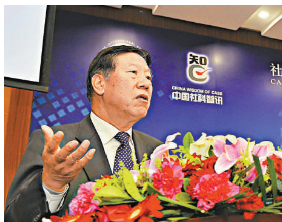
▲17日，戴相龍建議劃撥中央企利潤彌補養老金缺口，實現養老金帳戶的可持續發展 新華社

【本報訊】據中新社北京十七日消息：中國社科院17日發布的《中國養老金發展報告2012》指出，2011年，中國城鎮職工基本養老保險收不抵支的省份減少到14個，收支缺口高達767億元（人民幣，下同）。