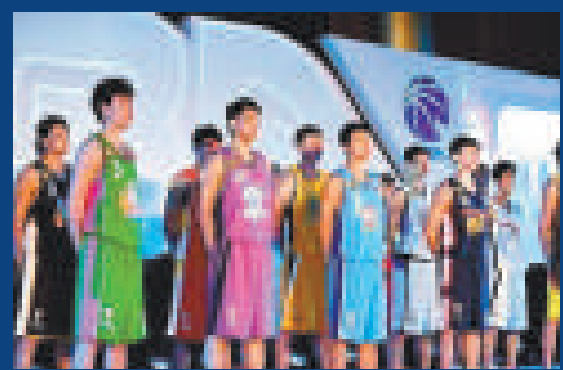
▲李寧以5年20億元人民幣的天價，成為中國男子籃球職業聯賽官方戰略合作夥伴

存貨積壓幾近瀕斃體育用品行業，面對高層要員接連跳船、大股東李寧透過財技變相減持股份，負面消息不絕於耳的李寧(02331)，拋出1.8億元(人民幣，下同)的「渠道復興計劃」，務求解決銷售渠道庫存積壓的問題。不過，分析員料成效難見，加上李寧再次發盈警，有機會成為首家全年業績「見紅」的體育用品股，拖累該股跌近4%。