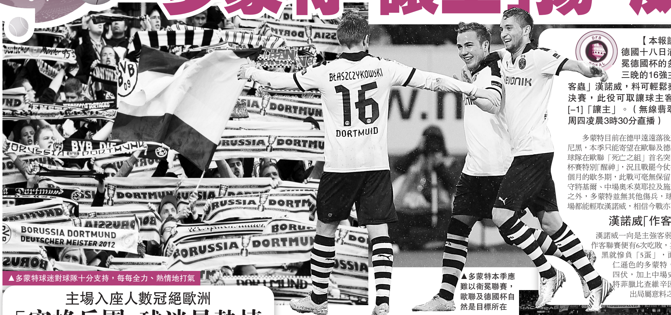
▲多蒙特球迷對球隊十分支持，每每全力、熱情地打氣