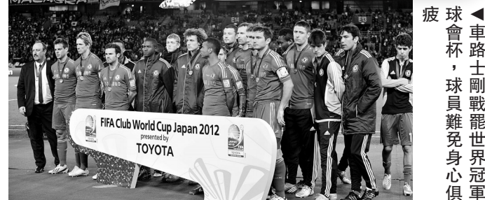
▲車路士剛戰罷世界冠軍球會杯，球員難免身心俱疲

【本報訊】綜合外電英國十八日消息：在世界冠軍球會杯鏖戰歸來的車路士，需立即收拾心情出戰英格蘭聯賽杯8強作客英冠球隊列斯聯之戰，但在舟車勞頓、身心俱疲下，恐難於法定時間內擊敗主隊，此戰可考慮捧主客和的局。