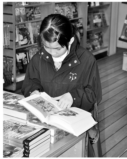
◀孩子在閱讀聖誕書冊