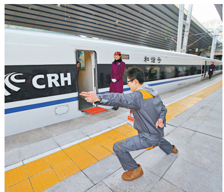
▲一位記者在站台上擺出「航母style」