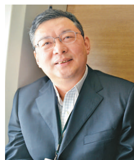
▲鐵道部科技司司長周黎

全運行為前提，未來將在不斷試驗磨合的過程中，依據運行情況適時提高速度。若出現雨雪天氣，鐵路部門會加強監測，爲保證行駛安全，必要時會採取降速甚至停駛的措施。