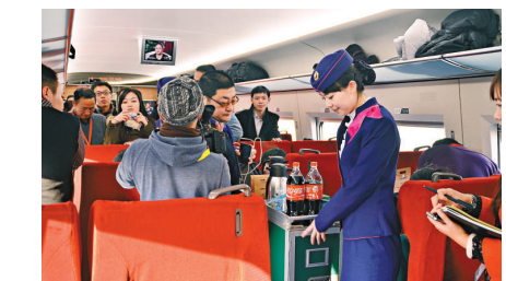
▲列車組乘務員爲乘客提供免費的食品飲料