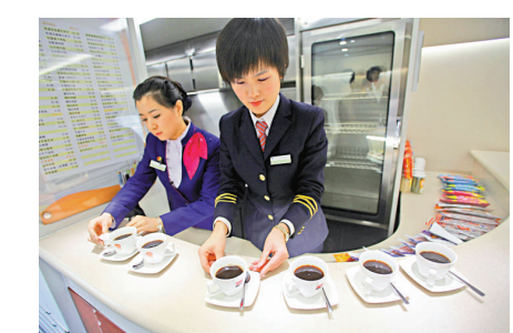
▲列車服務員在提供咖啡服務

列車車窗所採用的高技術玻璃，保證在高速運行中窗外的景物不變形。從皚皚白雪的北國風光，穿越至綠樹成蔭的南國夏日，一日之內飽覽隆冬、盛夏，旖旎風光將是京廣高铁另一個迷人的處。