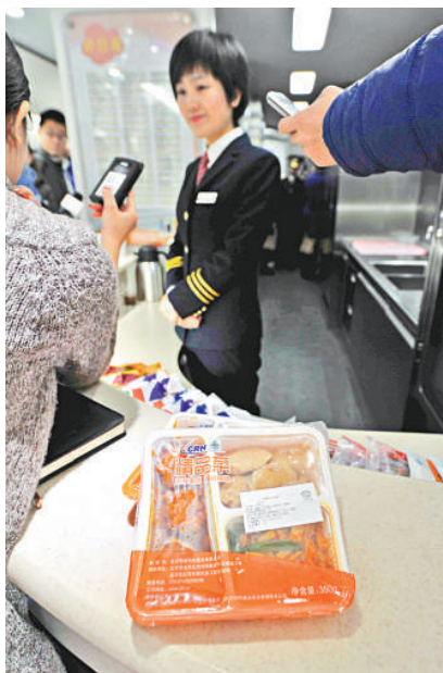
▲G83次列車上提供的盒飯

子彈形車頭、潔白的流線型車體、靚麗的乘務員……儘管人們對停靠在北北京西站全新站台上的和諧號列車早已不再陌生，但在「世界運營里程最長的高速鐵路」盛名之下，京廣高铁的首次公開亮相，依舊牢牢吸引住來自超過200家中外傳媒記者的眼球，仔細打量着這一車輪上的「中國速度」。