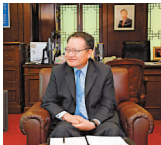
▲韓國前駐港總領事石東演

作為近鄰，韓中兩國擁有數千年的友好交流歷史，並且在過去20年裡又共同譜寫了新的歷史篇章。兩國在經濟貿易、人員和文化交流，以及政治外交等領域都取得了驚人的發展。兩國貿易額從1992年建交時的64億美元增加到2011年的2456億美元，增長了約37倍。如今，中國是韓國最大的貿易夥伴，韓國也是中國的第三大貿易夥伴。韓國對華貿易額超過了韓國與第二大貿易夥伴日本和第三大貿易夥伴美國之間的貿易總額。韓國累計對華投資總額也由1992年的不足2億美元增加到現在的500多億美元。兩國共有約14萬留學生正在對方國家，為迎接美好明天而拼搏。