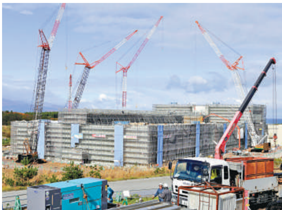
▲日本青森縣11月9日正在修建可循環燃料存儲中心

六所工廠一旦啓用，每年可再處理800噸乏燃料，生產約5噸鈾和130噸MOX，從而成為世界上第二大MOX生產廠。政府和核工業都希望大間先進核反應堆盡可能多地使用鈾。該工廠使用的鈾要比常規反應堆多三倍。六所再處理廠在2006年至2010年提煉了約2噸的鈾，但該廠發生一系列機械問題，其商業啓用已推遲了很多年。最近又把鈾提煉廠的啓用推遲至明年。