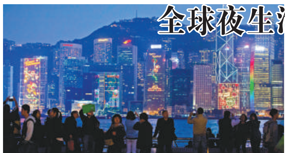
▲香港在全球最佳夜生活之都中排名第7位