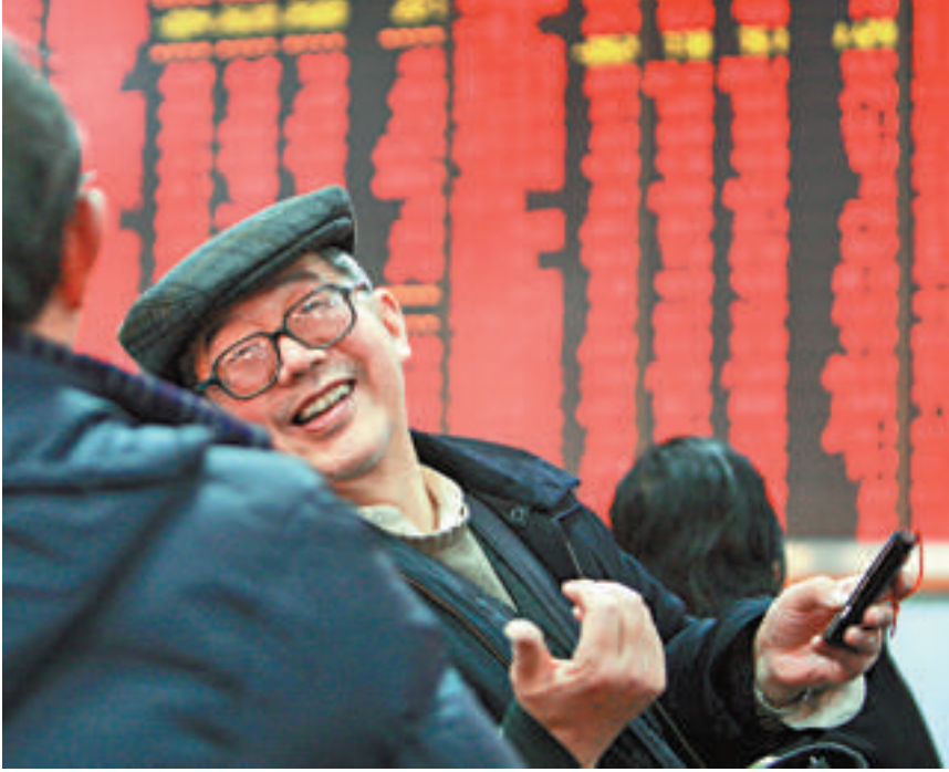
▲A股連漲四周，股民心情舒暢