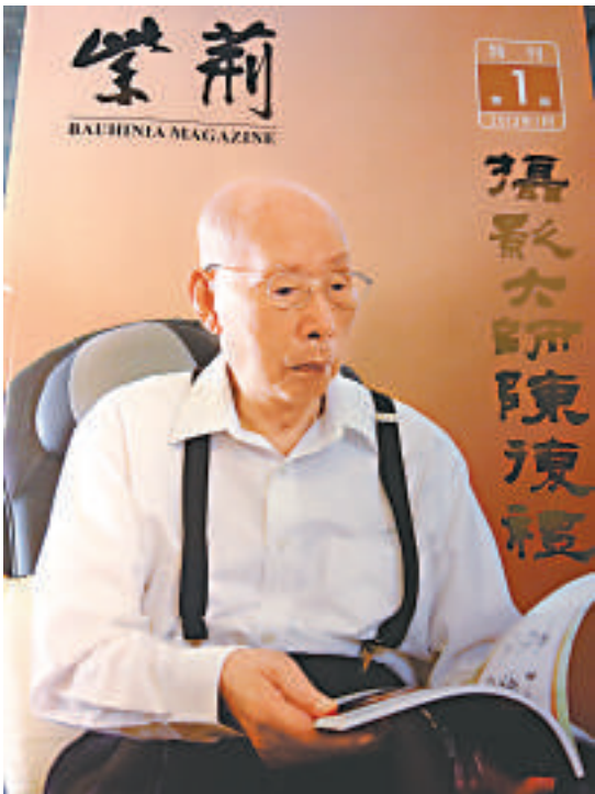
▲《紫荊》雜誌《攝影大師陳復禮》封面

【本報訊】實習記者呂顏婉倩報導：《紫荊》雜誌社與百利建國際有限公司一月三日晚於灣仔港灣道會議展覽中心西南翼七樓皇朝會，共同主辦《攝影大師陳復禮》特刊出版儀式暨晚宴，已屆九十六歲高齡的陳復禮親自到場主持，本地文化界及香港社團領袖應邀出席晚宴。