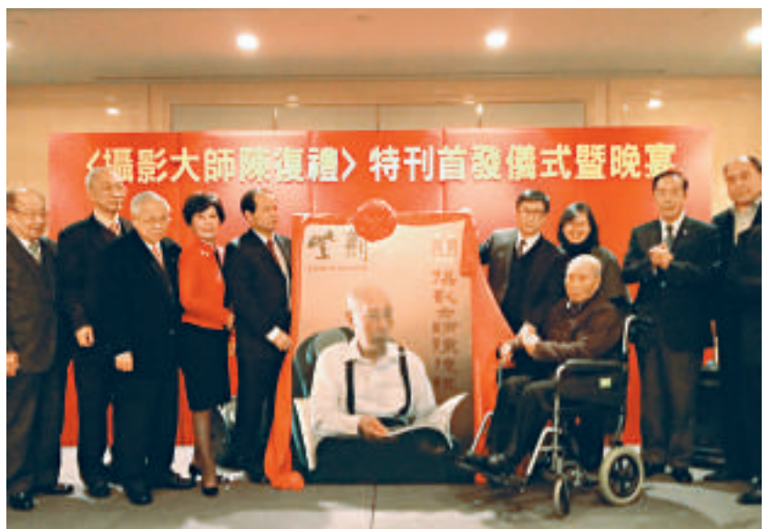
▲《攝影大師陳復禮》特刊首發儀式暨晚宴現場