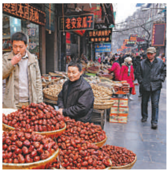
▲去年，內地共查處食品安全問題1.12萬件，保障了消費者的權益。圖為陝西省西安市一名商販（左二）在銷售食品。

黃曉薇透露，2012年1月至11月，全國共糾正土地和礦產資源開發中的違法違規問題2.75萬個，有3891人受到黨紀政紀處分，糾正環境保護違法違規問題2.21萬個，有305人受到黨紀政紀處分。